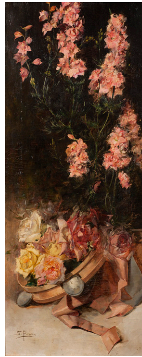
Pandereta de rosas , circa 1922 Óleo sobre lienzo, 81 x 34 cm Museo de Bellas Artes de Murcia

Podemos ver su obra en diferentes formatos, ya que colaboró en la realización de bocetos para carrozas, en portadas de libros, en temas religiosos para iglesias, como la de La Unión, o en carteles para fiestas y diferentes eventos.