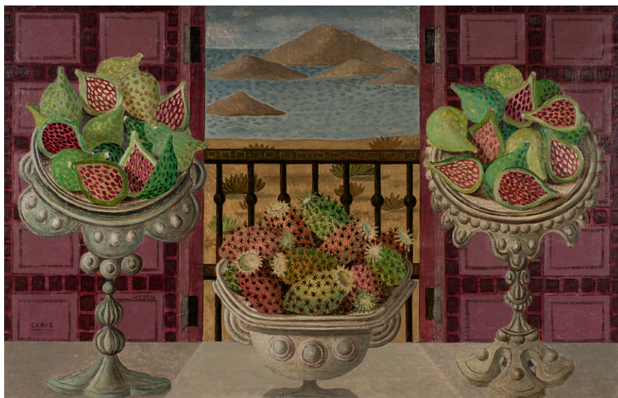
Bodegón de los higos Óleo sobre lienzo, 80 x 125 cm Colección particular