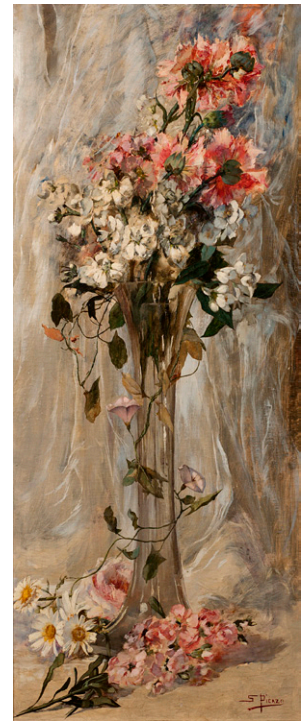
Claveles y margaritas , circa 1922 Óleo sobre lienzo, 81 x 34 cm Museo de Bellas Artes de Murcia