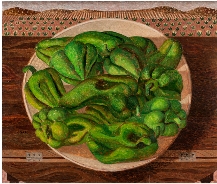
Pimientos verdes, S/F Óleo sobre lienzo, 54 x 65 cm Museo de Bellas Artes de Murcia

En la Región realizó también varias vidrieras religiosas como las que podemos ver en la Iglesia Sagrado Corazón de Jesús en Molina de Segura, o paisajes, sobre todo de la zona del Mar Menor, a los que dedicó parte de su última etapa como pintor.