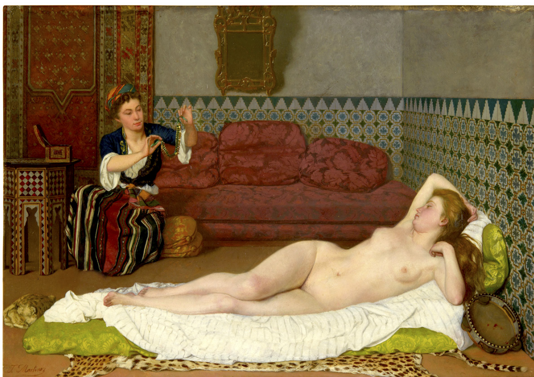
Odalisca, de Juan Mtnez Pozo