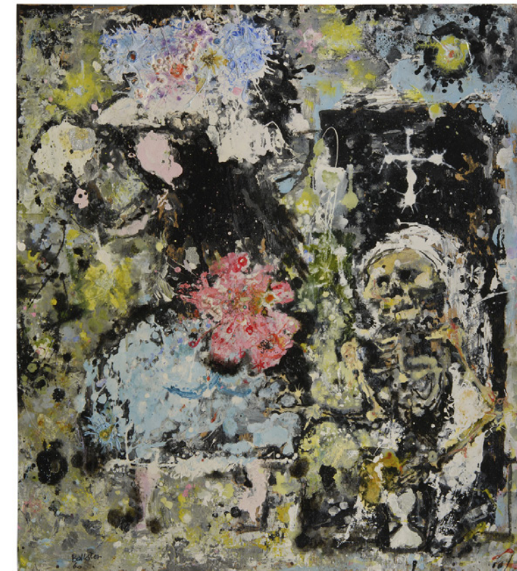
Mariano Ballester. La juventud, la vejez y la muerte . 1960