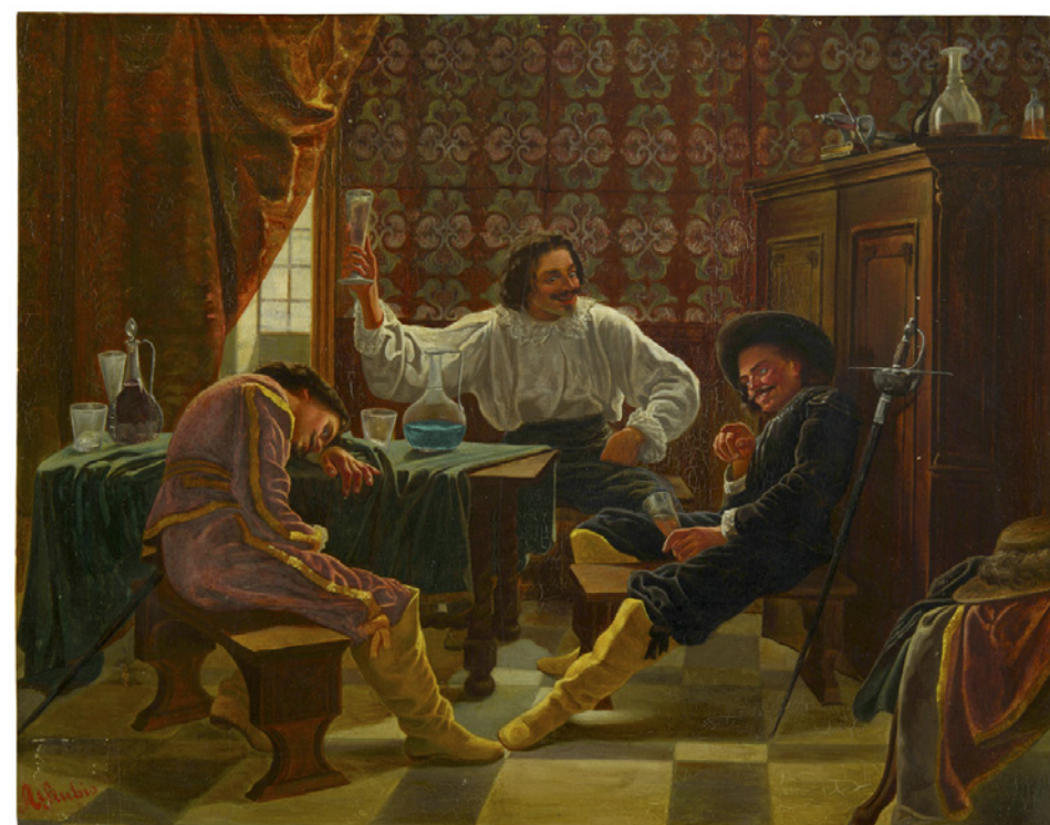
Los mosqueteros de Luis XIII, de Adolfo Rubio.