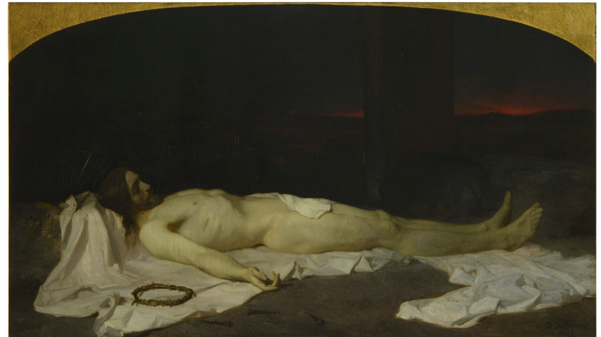
Domingo Valdivieso y Henarejos. Cristo Yacente . 1863

Pequeña opinión personal, valoración (positiva o negativa). Si conocías ya al pintor, su obra, la época. Otras obras de él/ella.