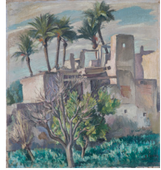
Huerto de cipreses Pedro Flores