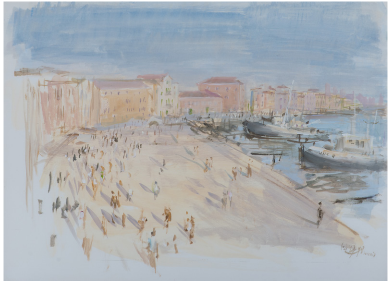
Ramón Gaya Riva de Schiavoni , 1978 Gouache sobre papel, 35 x 48 cm Museo Ramón Gaya

En cuanto a la temática destacan los bodegones, los retratos y paisajes.