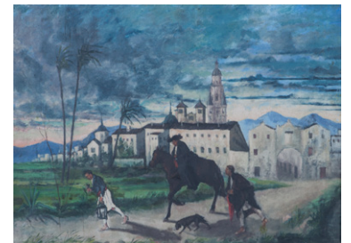
El viático en la huerta Gil y Montejano