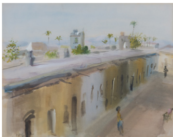
Calle de Murcia desde el Malecón Ramón Gaya

2.- Identifica y nombra en los siguientes cuadros que verás en el museo los tipos de paisaje que acabas de definir.