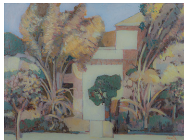
El jardín de la cubana Aurelio