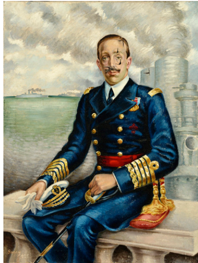
Retrato de Alfonso XIII