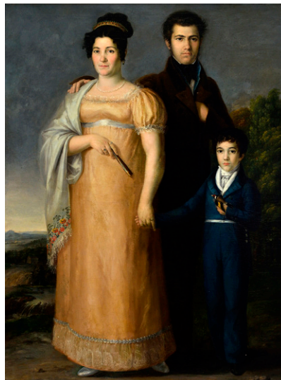
Retrato de familia