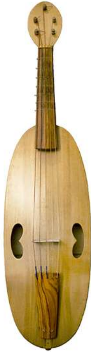
Arriba: Viola medieval.