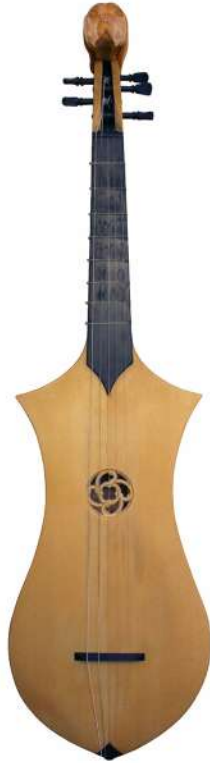
Arriba: cítola, quitara, o guitarra.