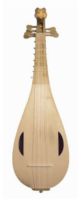
Arriba: Guiterna o pequeño laúd.

Izquierda: Cantiga 120. Podemos ver a dos músicos: uno podría ser un trovador sevillano al que llamaban "El Trianero", y el de la derecha, el propio rey Alfonso recibiendo clases del músico andalusí.