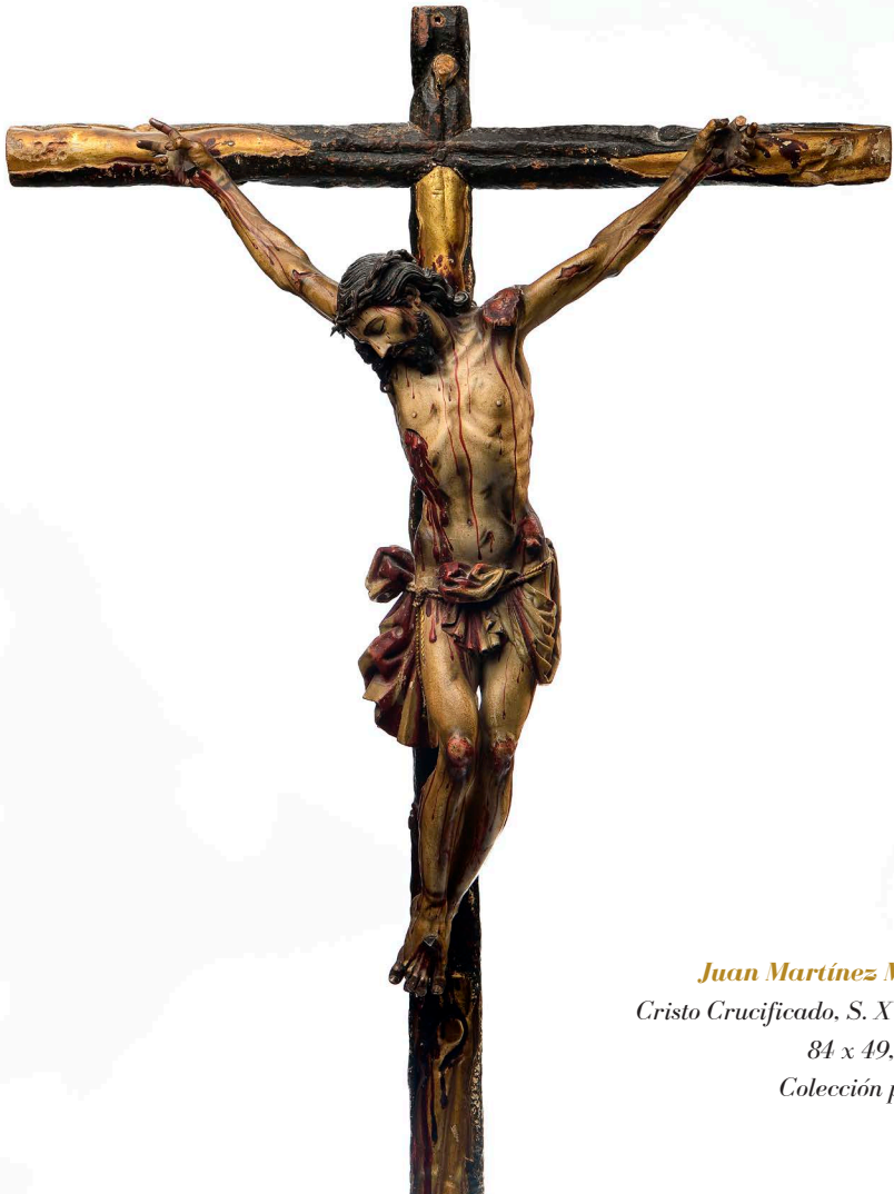
Juan Martínez Montañés Cristo Crucificado, S. XVII/XVIII 84 x 49,5 x 16 cm Colección particular