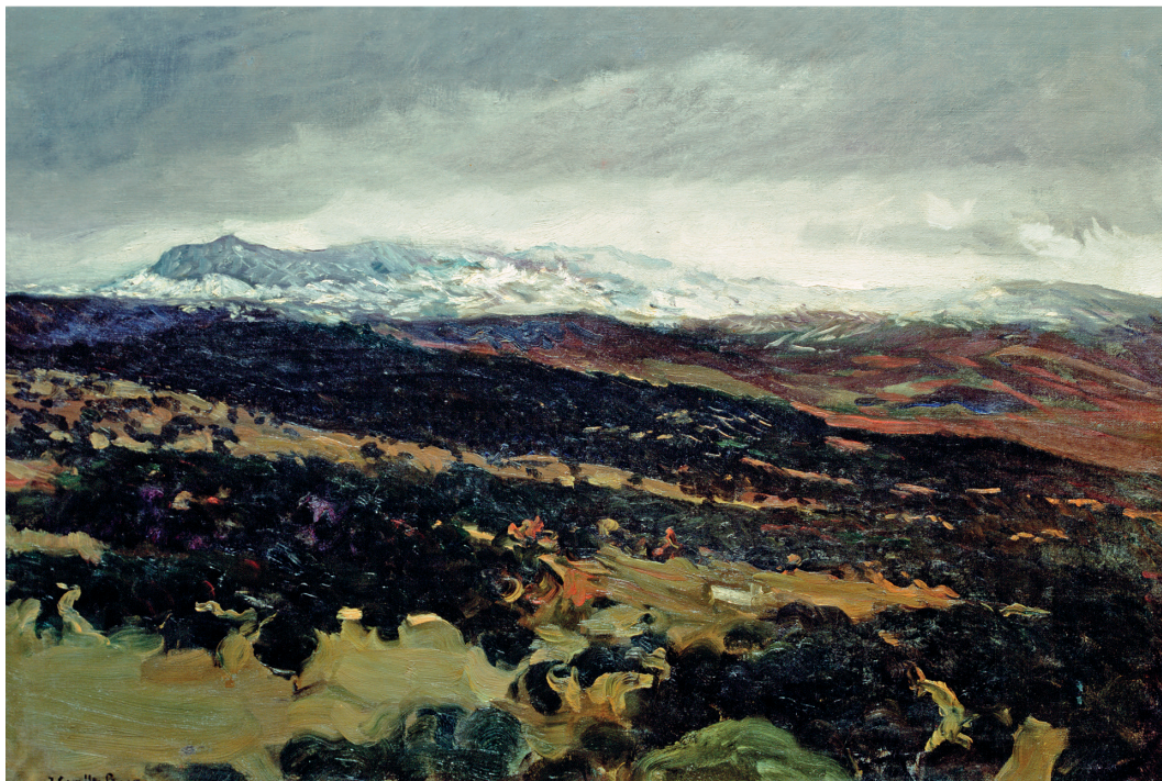
Vista de Torneo, El Pardo 1907 Óleo / lienzo / 62,5 x 91 cm