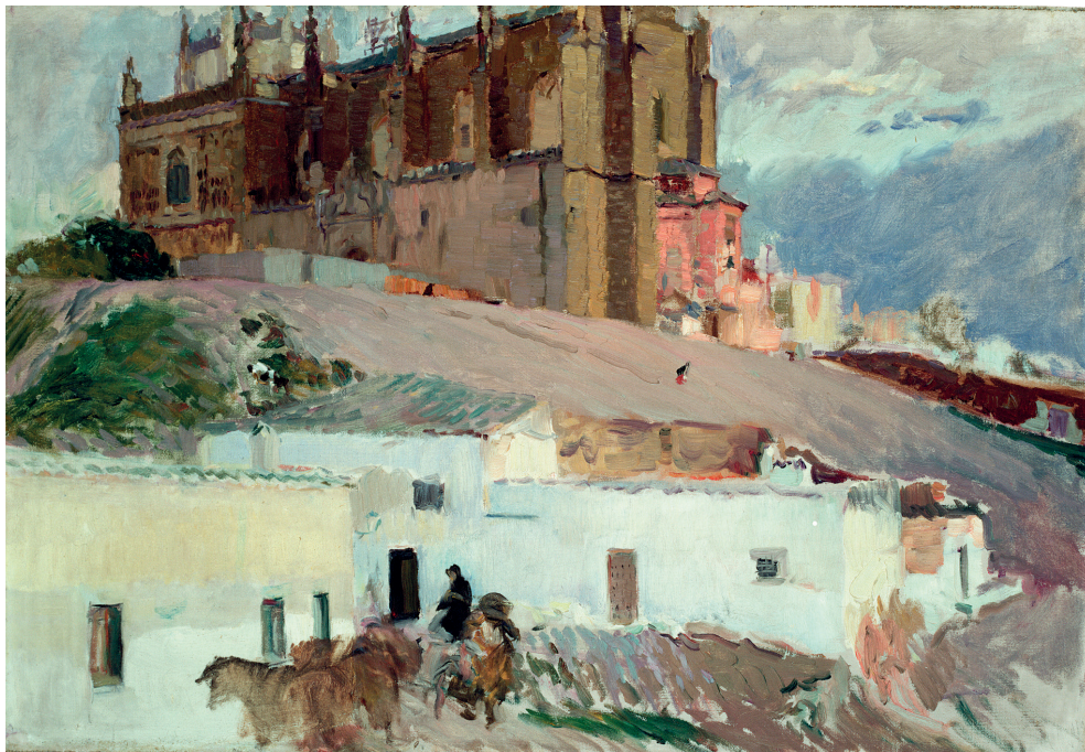
La Catedral de Burgos nevada 1910 Óleo / lienzo / 104,5 x 84 cm