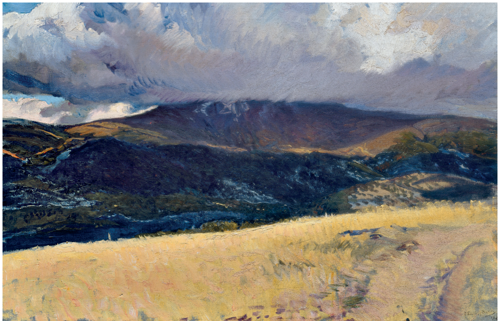
Tormenta sobre Peñalara, Segovia 1906 Óleo / lienzo / 62 x 93 cm