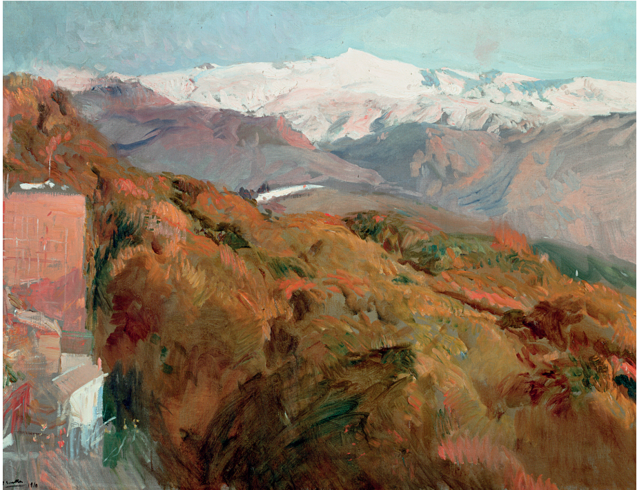
Sierra Nevada en otoño, Granada 1909 Óleo / lienzo / 82 x 106 cm