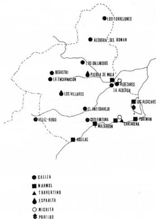
Fig. 78. Distribución geográfica de los capiteles con el tipo de roca utilizada

El comercio de mármoles de colores estuvo muy difundido por todo el imperio: el mármol negro de Quios, el amarillo de Numidia, el blanco de Carrara y penthético, pórvido rojo de Egipto, mármol proconesio blanco veteadado de gris, etcétera (HENING, M. 1985, p. 55). El fragmento nº 23 de una placa capitel corintizante del Huerto del Paturro está realizado en páfido rojo y procede probablemente de las canteras de Gebel Dokhan en Egipto (GNOLI, R. 1971, figs. 90-91).