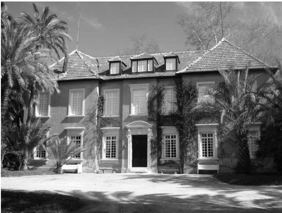
Figura 5. Casa del Parque en Ulea. Finca madre de los Baños de Archena que quedó separada de ésta tras la venta de los mismos.

El desarrollo de la agricultura, sobre todo en la zona de Abarán y Cieza, supuso un enriquecimiento de las familias, procurándose un tipo distinto de ciudad y por lo tanto de viviendas, las conocidas tipológicamente como «arquitectura burguesa». Con el desarrollo industrial nacieron los ensanches y también se instalaron infraestructuras para producir electricidad, como las fábricas de luz de Cieza, Abarán, Blanca, Ojós, Ulea y Archena, que se encuentran en la actualidad casi abandonadas por la transformación de la industria eléctrica. Se abandonan las salinas de Ojós, los molinos, almazaras y demás sistemas tradicionales de extracción de bienes alimentarios. Sin embargo, los lavaderos públicos siguen siendo utilizados hasta la actualidad.