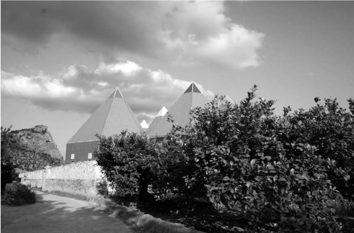
Figura 7. Ludoteca de Ricote en medio de su fértil huerta.