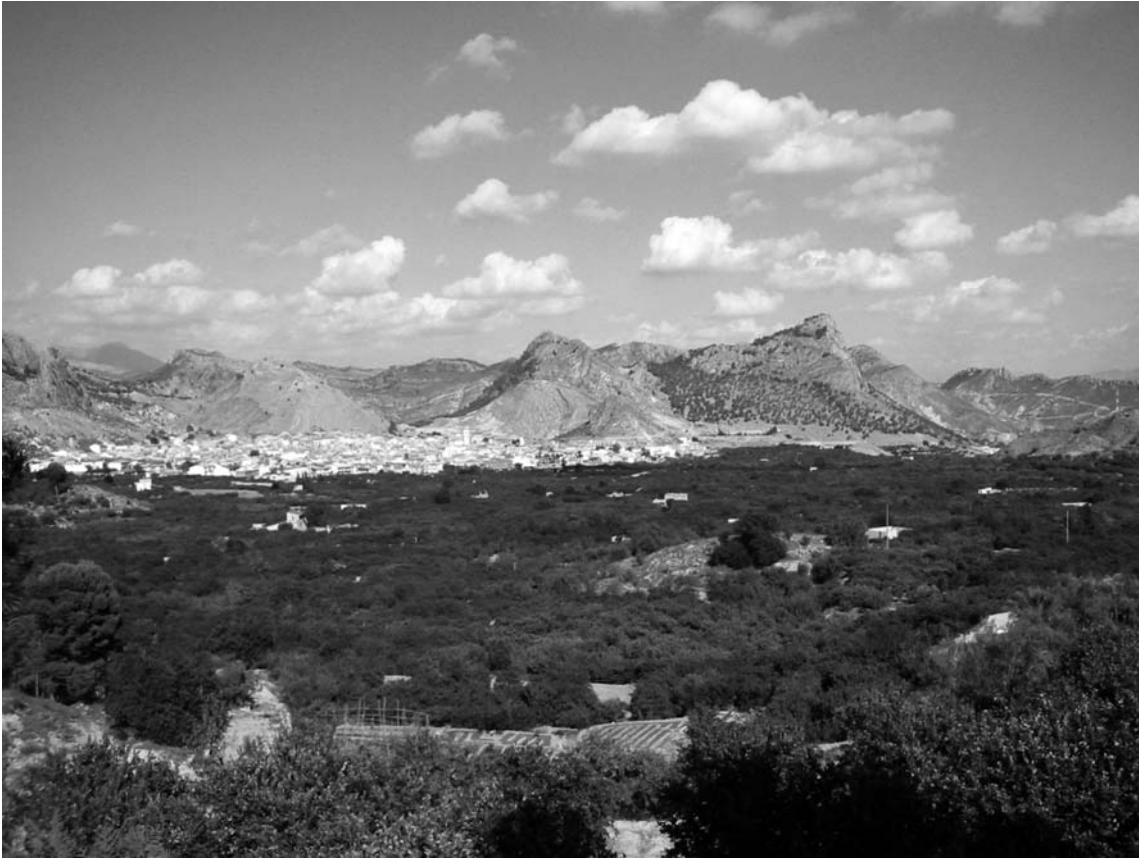
Figura 2. Huerta de Ricote

El Ministerio se percató de que el Valle de Ricote precisaba de una figura de protección efectiva con el fin de preservar tanto sus valores culturales como naturales y para ello se redactó el Plan del Paisaje Cultural del Valle de Ricote incluyendo la siguiente información: