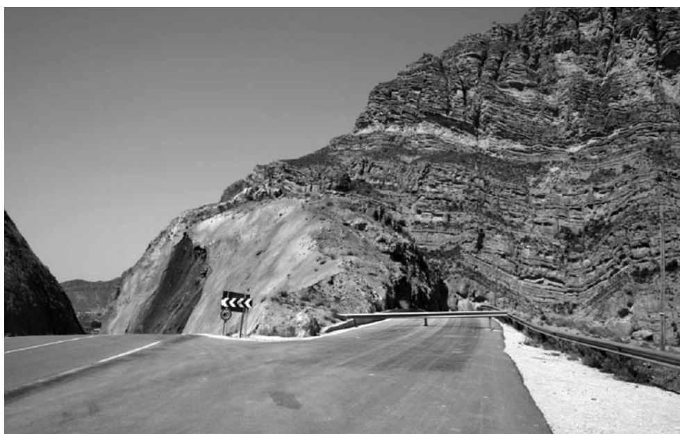
Figura 6. El Sorvente 11 , Ojós. La apertura de la nueva carretera ha provocado la modificación del microclima del Valle.

Como hemos visto en las líneas anteriores, la legislación prevé la salvaguarda del paisaje, por lo éste que debe ser preservado en toda su extensión. Tal vez sea por la ambigüedad del término, que la citada protección no haya sido efectiva hasta la actualidad. La construcción de la moderna urbanización de la Morra en Villanueva del Segura, las actuaciones de la Confederación Hidrográfica en las riberas del Río, la ocupación para servicios públicos como pistas deportivas o piscinas en el dominio público hidráulico y, la construcción de nuevas vías de comunicación, han hecho, que poco a poco, este maravilloso paisaje que a todos interesa y por el que todos nos preocupamos, en la actualidad se encuentre en vías de desaparición.