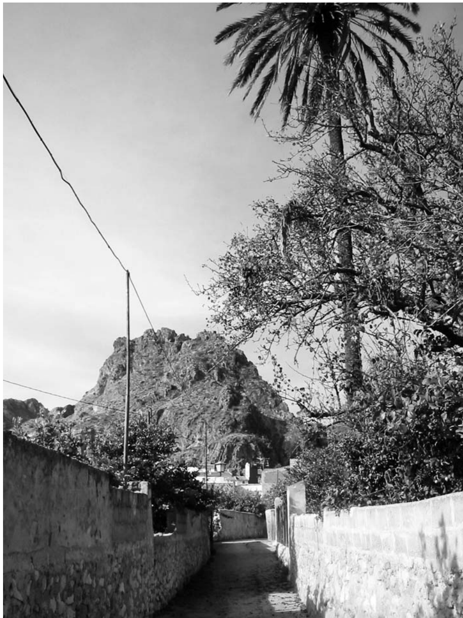
Figura 4. Camino de los huertos en Ojós.

Este tipo de arquitectura se conservó hasta bien entrado el siglo XX. Las viviendas se situaban al abrigo de los castillos en estrechas callejuelas, siguiendo los cánones del urbanismo medieval. Mientras que las norias elevaban el agua en la huerta salvando desniveles y alturas para llevarla a sus huertas.