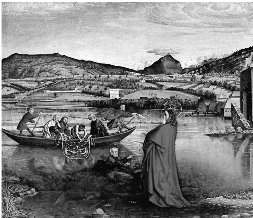
Figura 1. Conrad Witz- Cristo Caminando sobre el lago Genesaret (Ginebra, 1444)

Tal vez pocos conceptos han sido tan complicados en su definición, de hecho para buscar el origen del concepto de paisaje contamos con la tesis doctoral de Javier Maderuleo (2005). Según el autor, no será hasta el año 1737, en el Diccionario de Autoridades, cuando nazca dicho significado referido a las artes, definiéndolo como «un pedazo de país en la pintura». En cuanto al origen de la representación del paisaje en las artes es el historiador del Arte, E.H. Gombrich 1 quien después de detallar el gusto por la naturaleza en la pintura mural egipcia, griega o romana así como en las estampas japonesas, el arte oriental y musulmán, estipula que será el pintor suizo Conrad Witz (1400-1466?) el primer artista que represente un lugar reconocible no inventado, en su cuadro titulado Cristo andando sobre las olas , «... y para ello no pintó un lago sino el lago que ellos conocían, el de Ginebra, con el macizo monte Salève irguiéndose en el fondo. Se trata de un paisaje real que puede ser visto por cualquiera... Es ésta la primera representación exacta, el primer retrato de un paraje auténtico que se haya intentado». A lo largo de la historia, tanto la literatura como el arte, han dedicado numerosas obras a describir o dibujar paisajes, pero no será hasta el siglo XX cuando el paisaje sea estudiado por otras muchas disciplinas.