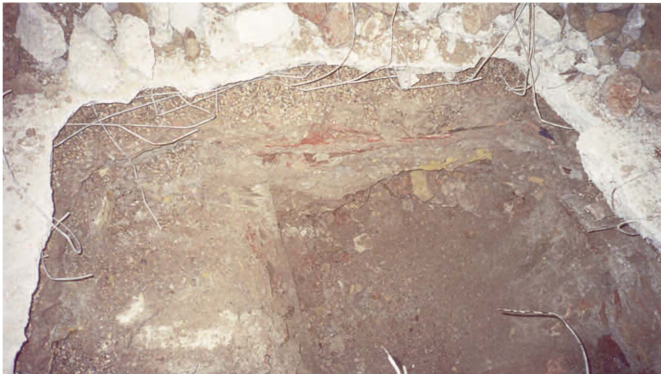
Lámina 1. Sondeo 1.

como preparación al pavimento. Aparecen restos de tierra lúguena. En el siguiente nivel comienza a aparecer la roca, que llega hasta la profundidad de 1 m a la que se detuvo la intervención, ya que se había sobrepasado en unos 20 cm la cota a la que se desfondaron las zapatas. Posteriormente se limpió el corte que acabó teniendo unas dimensiones de 2 m de longitud por 1,5 m de anchura y 1 m de profundidad máxima.