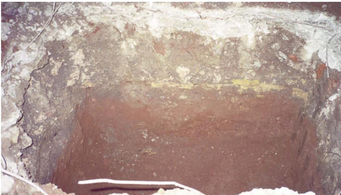
Lámina 2. Sondeo 2.