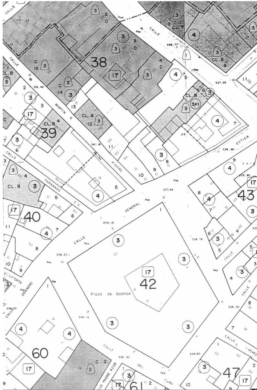
Figura 1. Situación del solar.

alcantarillado, cables de la luz y otras infraestructuras urbanas. Tras este nivel de relleno, empieza a aparecer la roca del cabezo, que va apareciendo en torno a una profundidad de 1-1,20 m. Bajo el muro de hormigón de contención y cemento de la Plaza, que iba montado sobre la roca y que delimitaba la zanja sondeo por el Este, se encontraron restos de tres sillares (Lám. 2) en la zona Sur, colocados a modo de