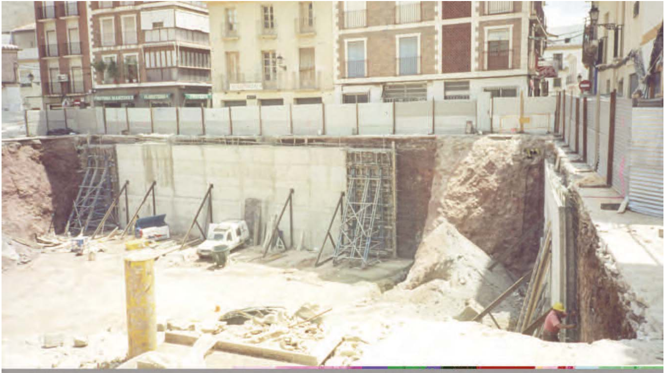
Lámina 1. Desfonde de la Plaza de Abastos.