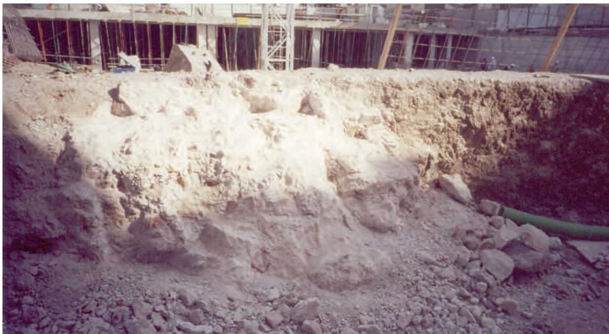
Lámina 3. Posible muro de la antigua iglesia de San Mateo.

En el lugar de la intervención, se ha documentado un cabezo de roca que no sería atravesado por la rambla mencionada en el punto anterior, ya que los niveles de ramblizo no aparecen al oeste de la parcela. Este cabezo de roca parece no haber sido utilizado hasta época medieval, cuando se instalaron en la zona unos graneros. Posteriormente, ya en el siglo XIX, se instala aquí un mercado o plaza, que tendría su continuidad en diversas edificaciones del siglo XX con la misma utilidad. La última, ahora demolida, fue levantada en la década de los 70 de dicho siglo.