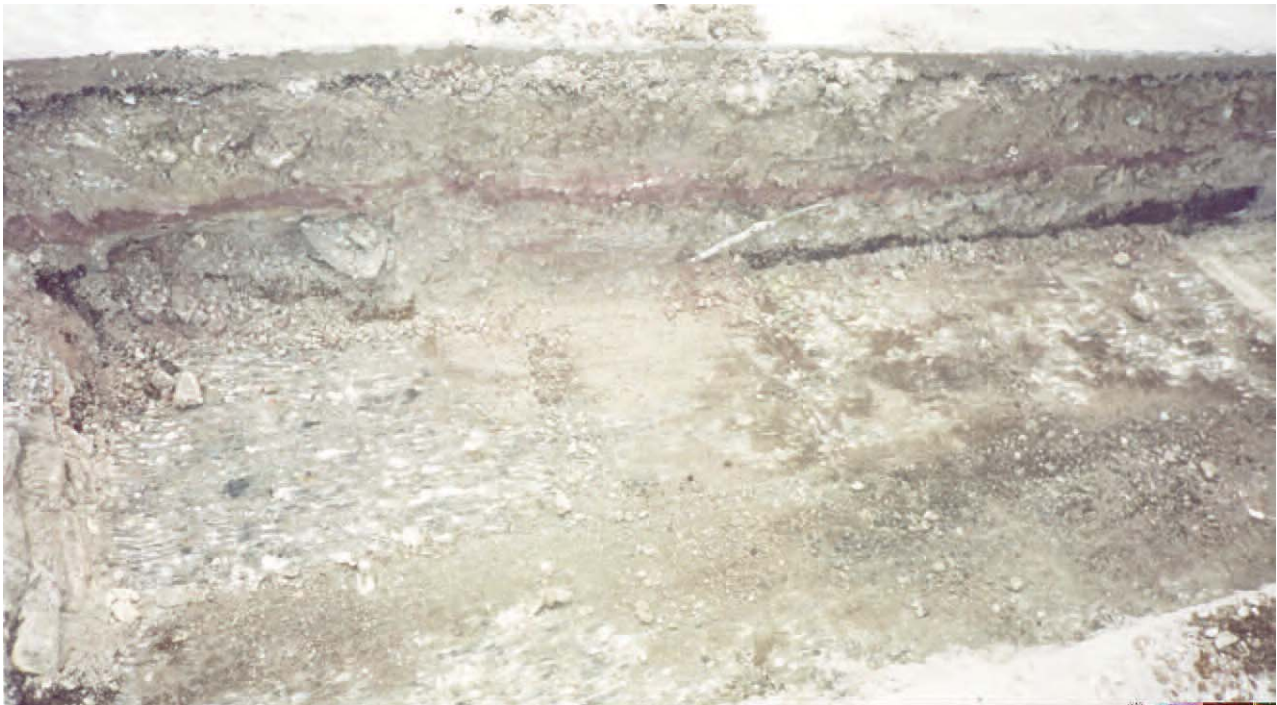
Lámina 2. Sondeo 1.