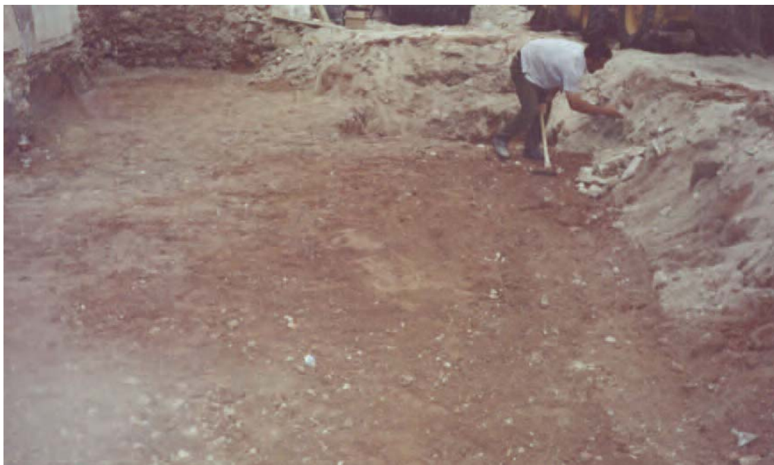
Lámina 1. Estrato rojizo de consistencia rocosa.