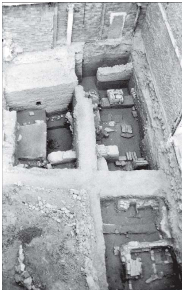
Foto 1: Vista general de las estructuras. Muralla, parte interior de la torre y restos de viviendas. Siglos XI-XIII.

En los estados en los que se embute la cimentación de la muralla documentamos un conjunto cerámico datable en el siglo XI, que se caracteriza por la presencia de piezas de cocina realizadas a mano o torno lento generalmente sin vidriar, fragmentos de formas cerradas decoradas mediante cuerda seca parcial, restos de ataifores vidriados en melado