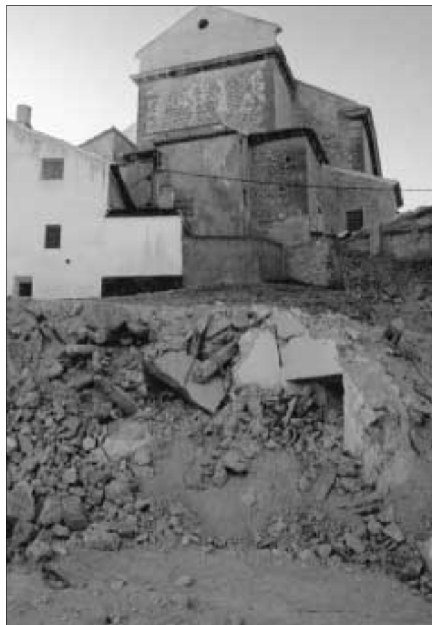
Figura 1. Solar 1, o manzana en pleno derribo, situado a la espalda de la iglesia de Santa María Magdalena.

Antes de acometer trabajos específicos de prospección, el estudio realizado en esta segunda fase se inicia con las