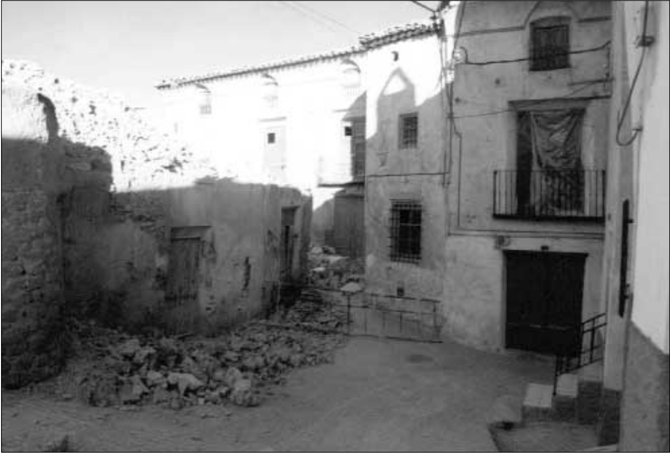
Figura 4. Rincón de los Cuatro Cantones durante las labores de demolición.

las estructuras descubiertas para que, cuando menos, pudieran visualizarse las desaparecidas líneas de fachada así como la estructuración interior de las viviendas. Esta recomendación fue bien acogida, por lo que el Ayuntamiento de Cehegín dedicó dos operarios a dicha tarea, dejando lectura visual del recorrido de la calles Iglesia y Esteban Zarco a su paso por el Solar 1, aunque no quedó tiempo para hacerlo con el segundo solar y tampoco se pudo dejar constancia de la estructuración interior de las viviendas estudiadas 10 .