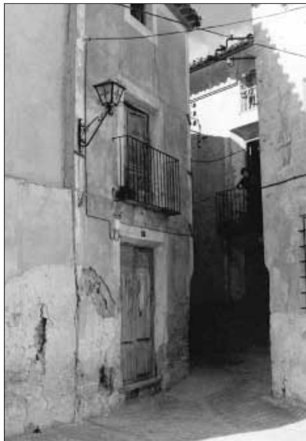
Figura 5. Rincón de los Cuatro Cantones, poco antes del derribo.

10 Recientemente, en cambio, se han llevado a cabo actuaciones de pavimentación en la calle Iglesia y se ha eliminado impunemente el trabajo realizado de recrecido y visualización de estructuras en el solar 1, por lo que el objetivo de dejar constancia del callejero medieval se ha visto definitivamente truncado.