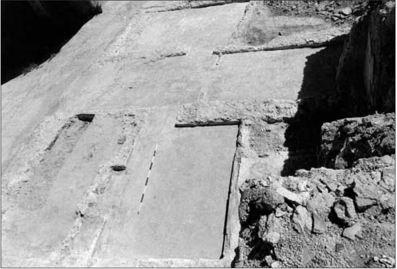
Figura 2. Solar 1, tras la limpieza y retirada de escombros.

deos se realizan uno para cada terraza de las dos que forman el solar. El primero, realizado en la parte Norte del solar (UU.EE. 10.800) ofrece el hallazgo de tres pavimentaciones y bajo éstas la superficie recortada de la roca original del cabezo sobre el que se asienta el yacimiento. El material es escaso (restos cerámicos de materiales de cubrición y de grandes recipientes). El segundo, zona Sur junto a un callejón inutilizado (UU.EE. 12.000), contiene un escaso relleno de material de desecho y de nuevo el recorte rocoso.