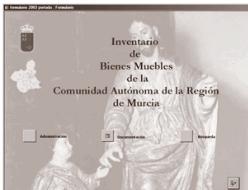
Figura 2. Portada del Formulario

Paralelamente a la base de datos, se ha creado un formulario principal que permite tener relacionados los datos puramente administrativos con la documentación existente en las fichas del Inventario.