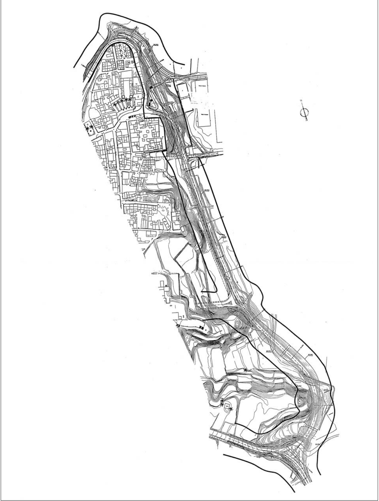
Figura 2. Transect de prospección arqueológica superficial.