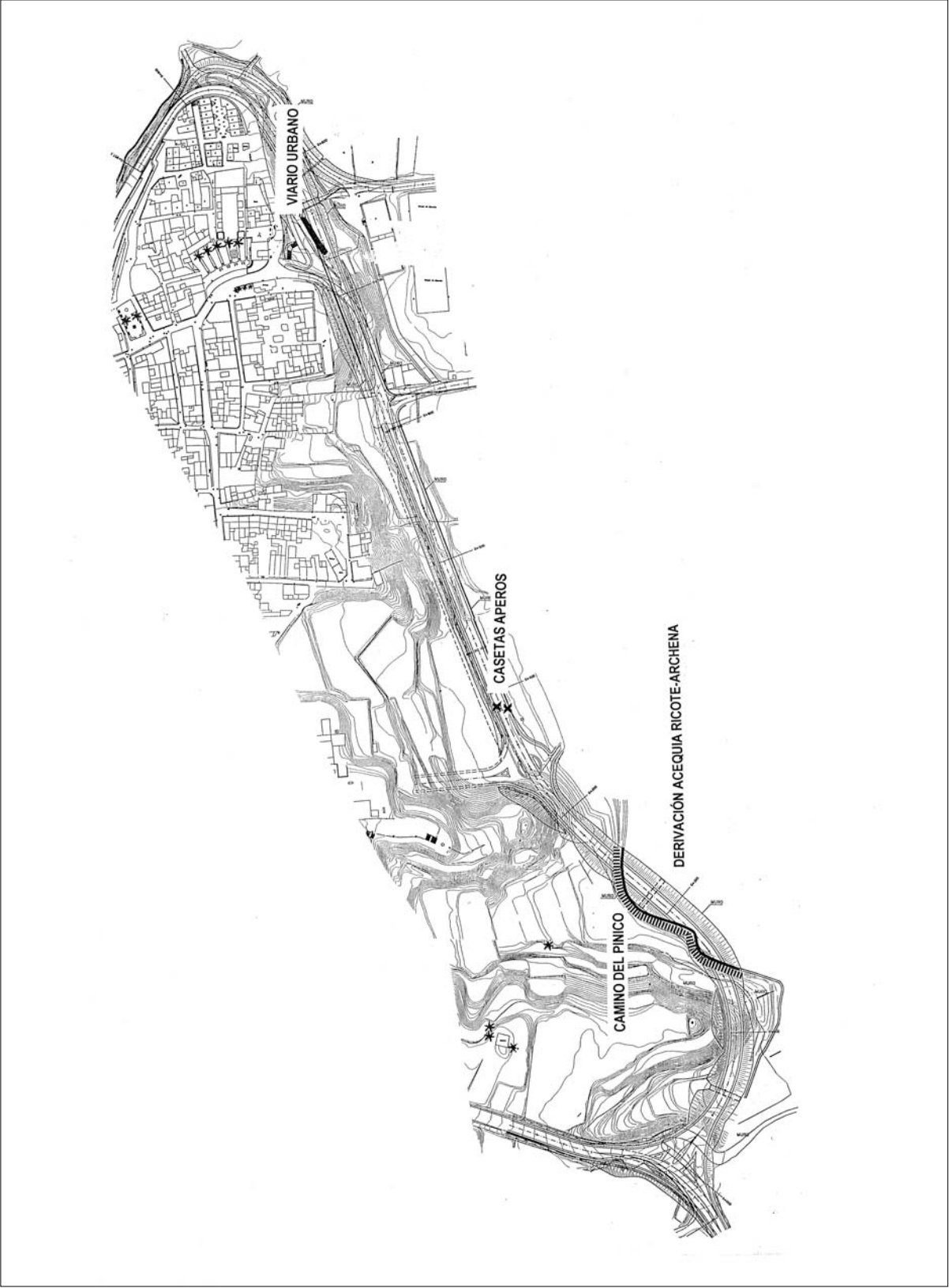
Figura 3. Población de elementos patrimoniales de impacto crítico.