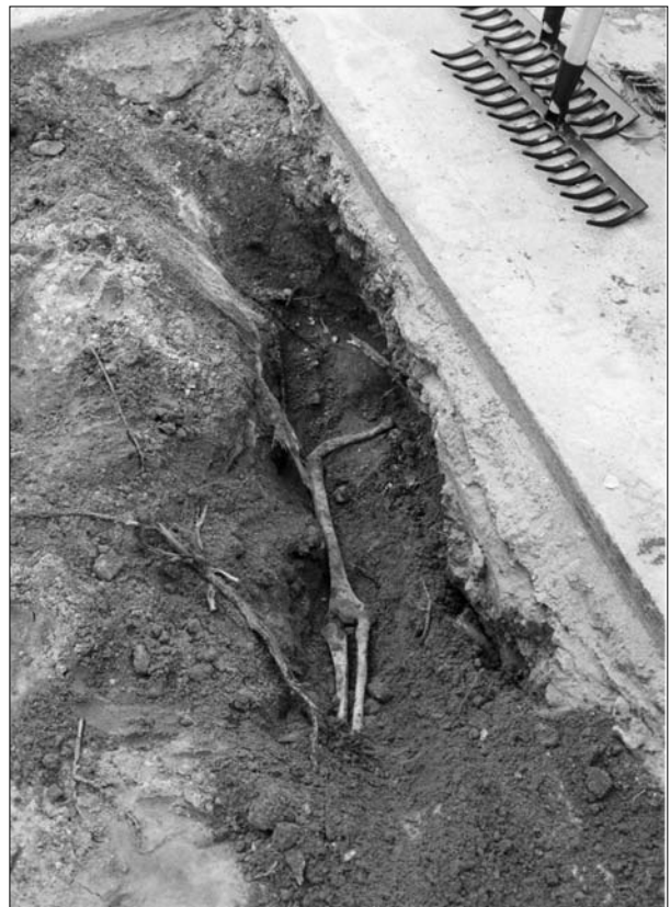
Lámina 8. Hallazgo casual de una sepultura islámica en el recinto nº 10 del Cementerio Municipal.

la dominación musulmana de la misma, al menos durante los 532 años que duró ésta.