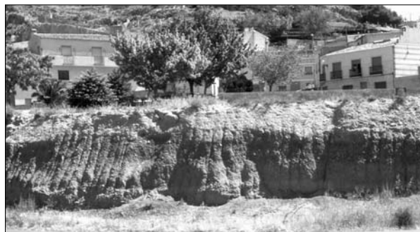
Lámina 2. Talud del Huerto Terreno, donde aparecen los esqueletos islámicos.

por las humedades procedentes de la cercana fuente de agua potable, que data de principios del siglo XX.