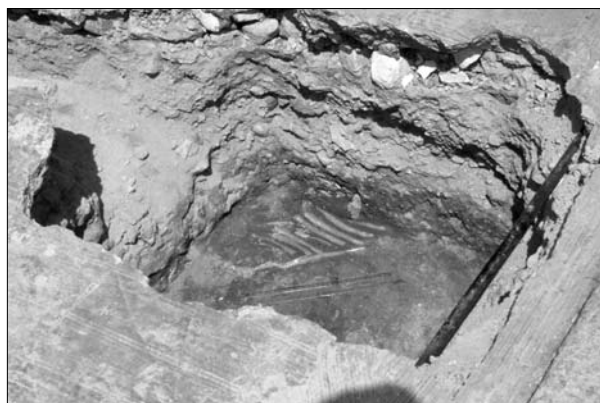
Lámina 5. Plaza de Arriba. Hallazgo de un esqueleto en el hueco de colocación de la farola de alumbrado público.

Ambos ritos realizados en un mismo espacio, aunque delimitado el terreno para cada una de las deposiciones según el rito, y a la vista de los materiales encontrados, las sepulturas se fechan entre el siglo VII y el siglo X (POZO y HERNÁNDEZ 2000: 422).