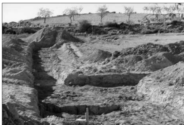
Lámina 6. Zanjas de prospección arqueológica en la Rinconada de Olivares.

A pesar del abultado número de sepulturas, no se han localizado restos de un posible poblado, alquería, etc. que nos indique donde vivían estos primitivos musulmanes.