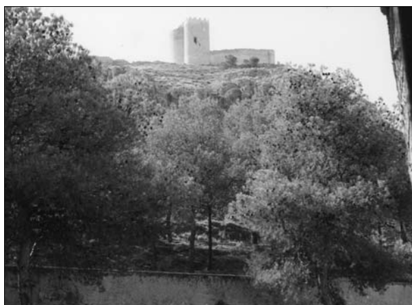
Lámina 9. El castillo de Jumilla desde la necrópolis musulmana del Cementerio Municipal de Santa Catalina. En primer lugar la necrópolis que queda fuera del recinto del Cementerio.

manantiales de agua potable a lo largo de su recorrido, y del Praico Somero, por donde discurre un pequeño caudal de agua, que da lugar al humedal denominado “Charco del Zorro”, localizado a escasos metros de la maqbara de la Rinconada de Olivares.