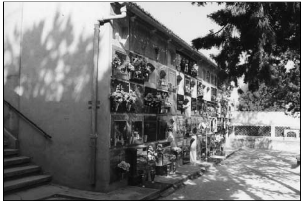
Lámina 7. Recinto nº 10 del Cementerio Municipal de Jumilla.

Por lo tanto nos podemos aventurar a hacer una distribución de la población de la comarca de Jumilla bajo