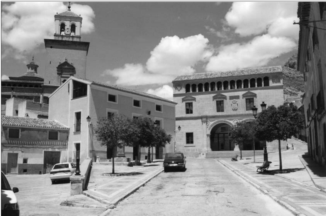
Lámina 3. Plaza de Arriba. En su ángulo NO apareció la necrópolis musulmana.