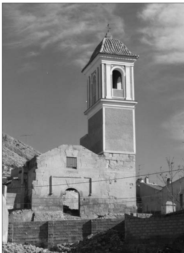
Lámina 1. Iglesia de Sta. M a del Rabal desde el Huerto Terreno.

El primer lugar donde se localizó una de estas maqbaras fue en la actual plaza de Arriba (Lám. 3), donde al plantar unos árboles ornamentales frente al edificio de la Universidad Popular, en marzo de 1993, se hallaron dos sepulturas con la deposición de los cadáveres por el rito musulmán. Una de ellas muy deteriorada y los huesos muy descompuestos, posiblemente afectada