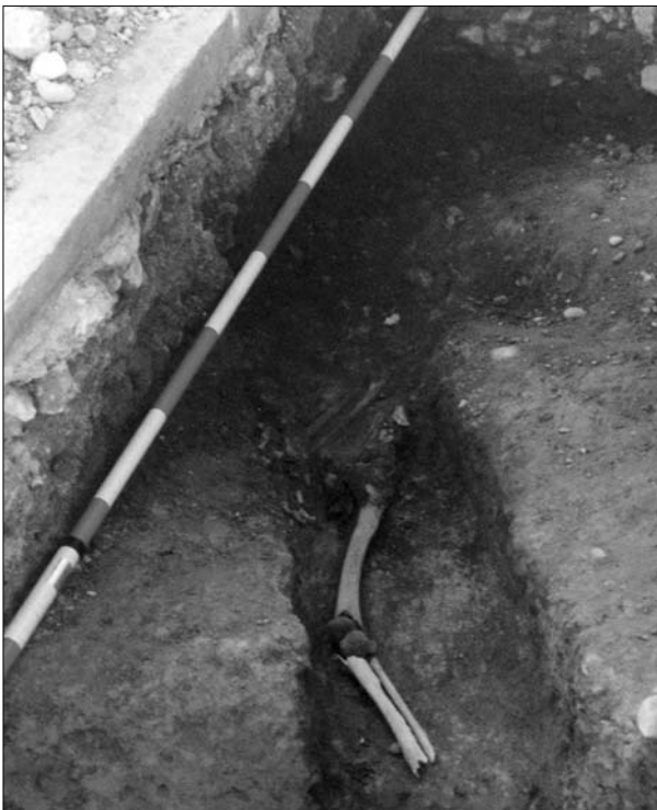
Lámina 4. Sepultura islámica de la plaza de Arriba.