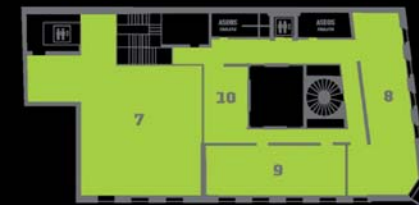
PLANTA SEGUNDA SECOND FLOOR