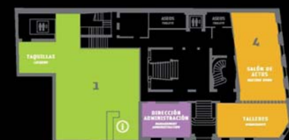
PLANTA BAJA GROUND FLOOR