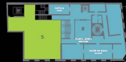
PLANTA PRIMERA FIRST FLOOR