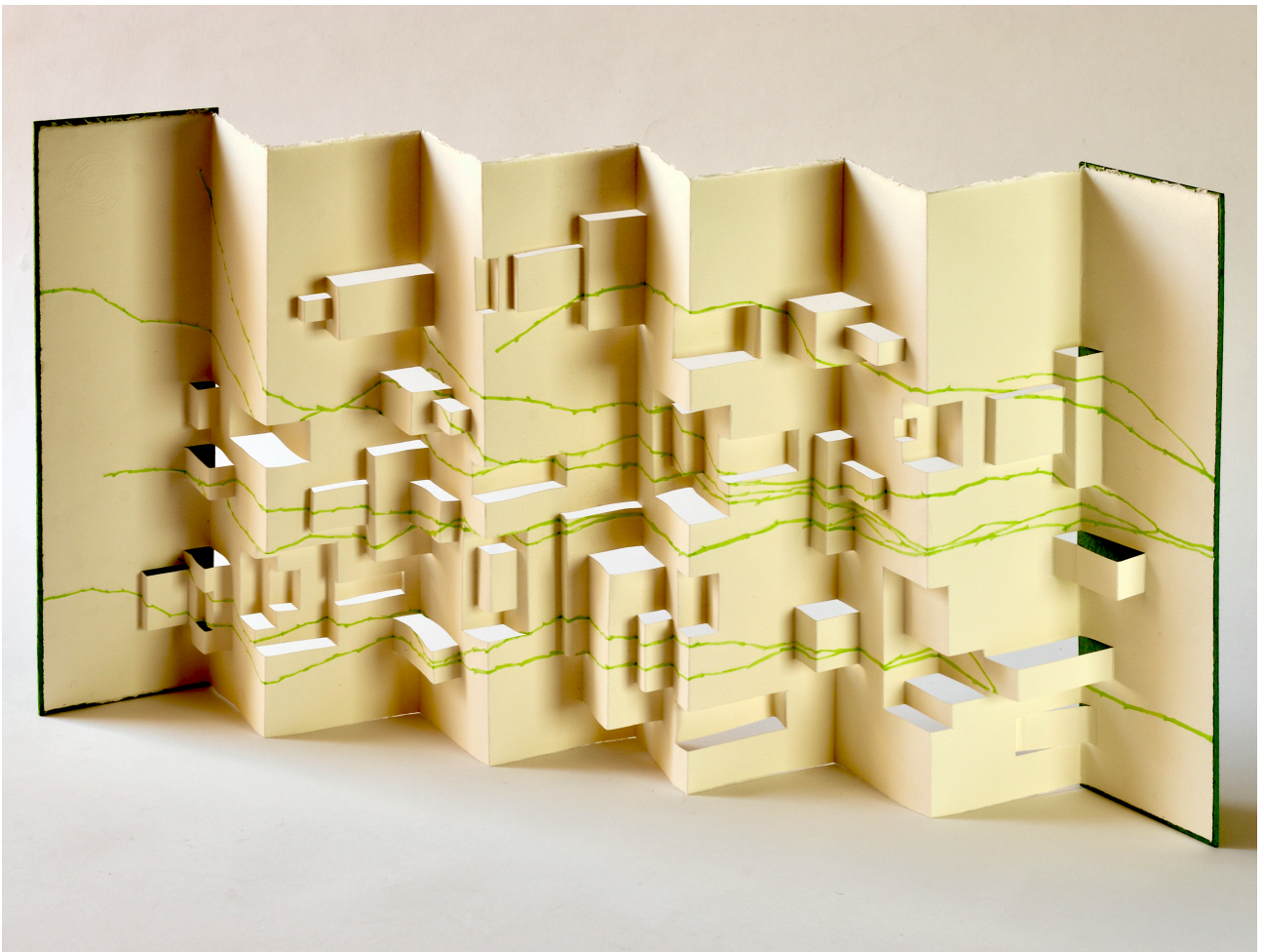
Antropía. Libro acordeón, 2022