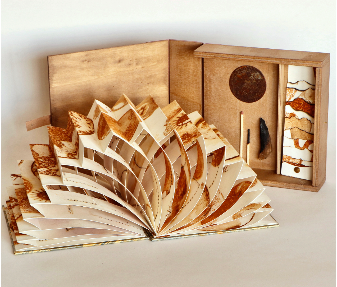
Entropía. Libro de banderas, 2022