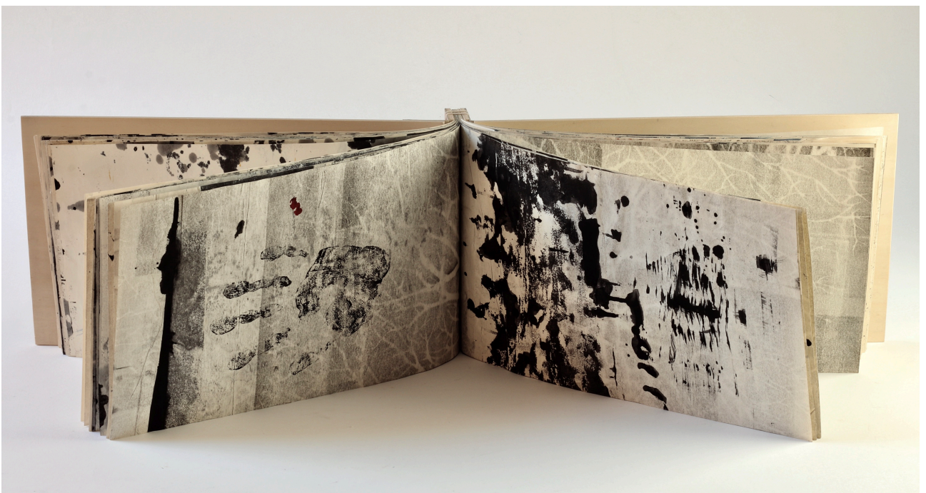
El resto que queda II. Libro Kangxi. 2020