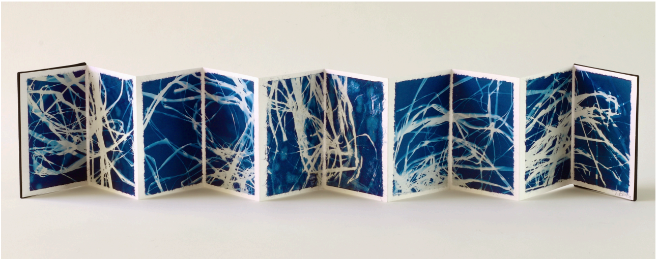
Fibras de luz. Libro acordeón, 2018