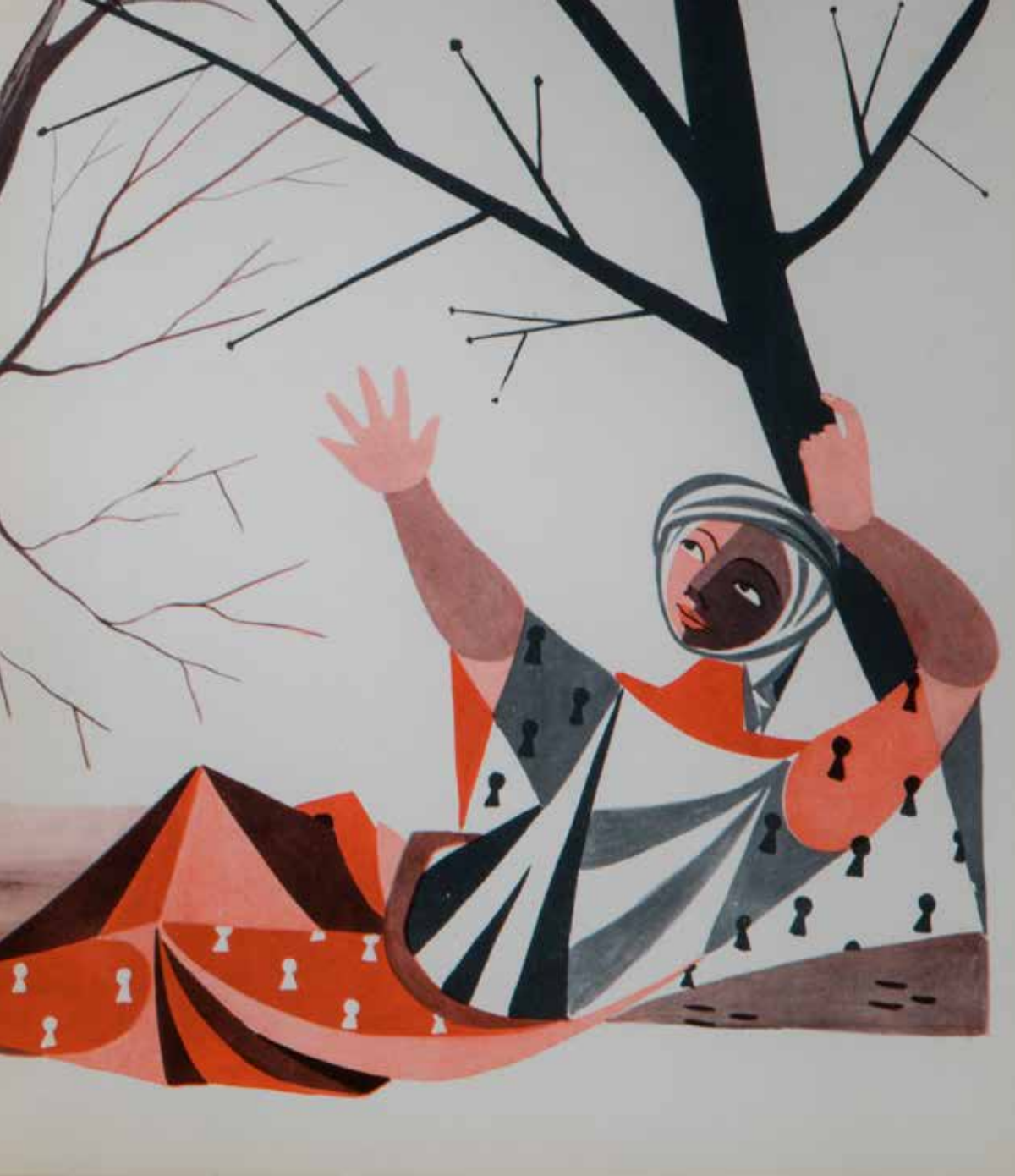
(Det. interior) El libro del desierto (Colección: El globo de colores) 1958 Texto: José Luis Herrera Ilustraciones: José Francisco Aguirre Editorial Aguilar 29,8 x 23,8 cm