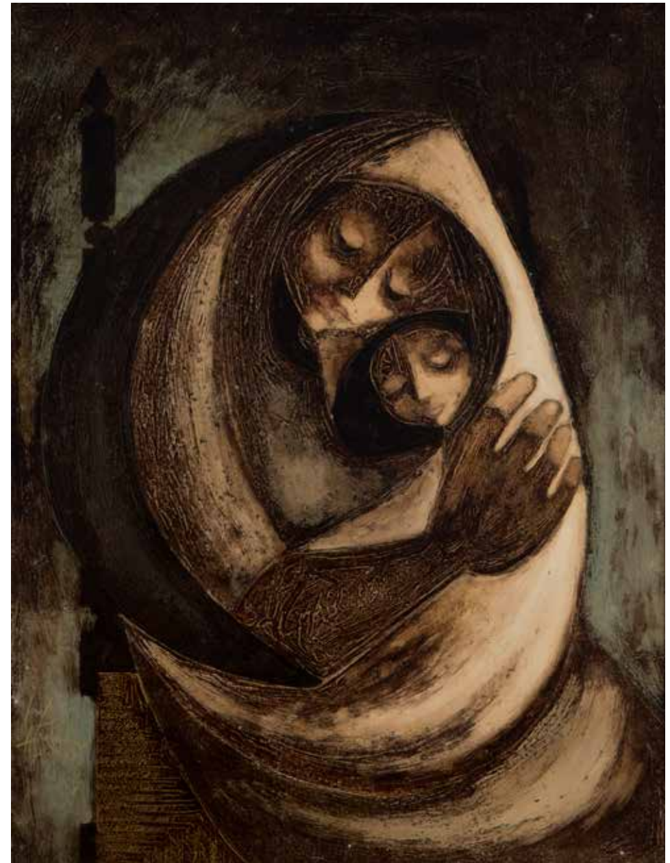
Maternidad / 1978 / Encáustica sobre madera / 64 x 50 cm

La Logia del Museo de Bellas Artes de Murcia, ese espacio clásico que asoma como galería acristalada al exterior, acoge íntimamente unas decenas de obras enamoradas. Y en unas vitrinas se enseñan fotos y originales de su quehacer de decenas de años de profesión. Todo en el Centenario de su nacimiento murciano, de la capital y del