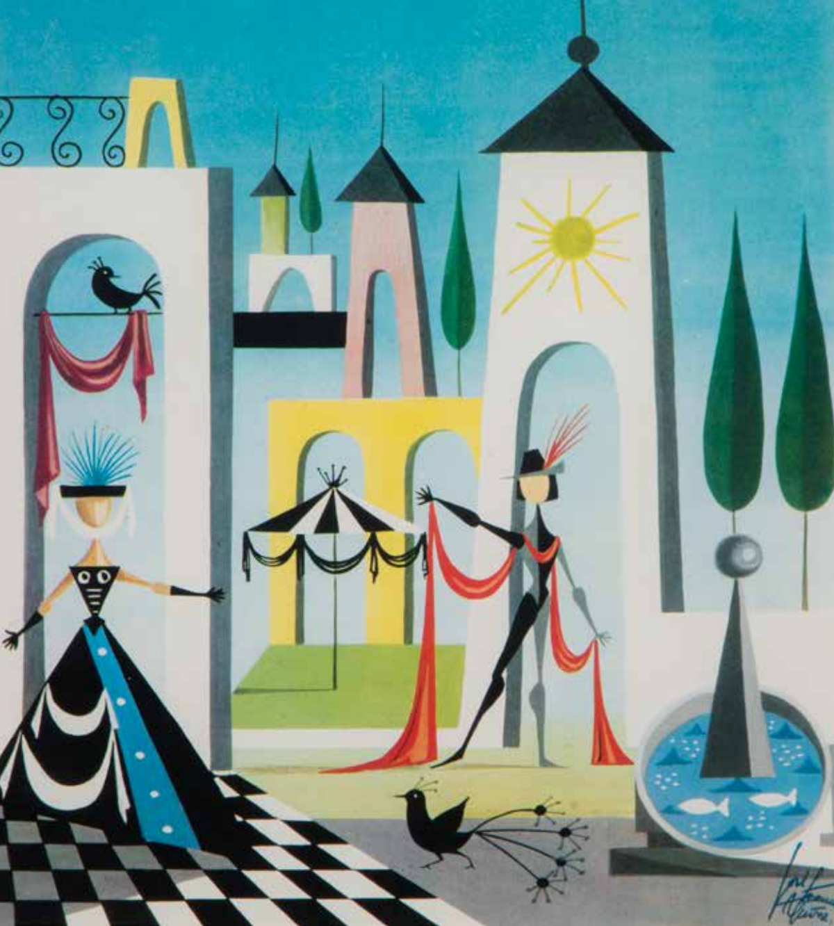
Escenografía / 1961 / Gouache cartón / 28,5 x 20 cm

centro urbano de la ciudad barroca y vocinglera. Es una invitación a ver lo que un murciano realizó alumbrando deseos de revivir un mundo mejor, más poético y limpio, desde perspectivas efectivas y afectivas con puntos de fuga que se vuelven hacia uno mismo, como un vuelo de golondrinas ensimismadas en el porche amigo. Queda también el teatro y su juego de luces artificiales de los falsos bastidores, que son fachadas de edificios de ventanas imposibles, de llamas amarillentas y parpadeantes. Y el sentido lúdico de las propuestas de alegre poderío escénico, la obra de José Francisco acompaña al disfraz y a la máscara, hace brillar mejor la lentejuela y el carmín.