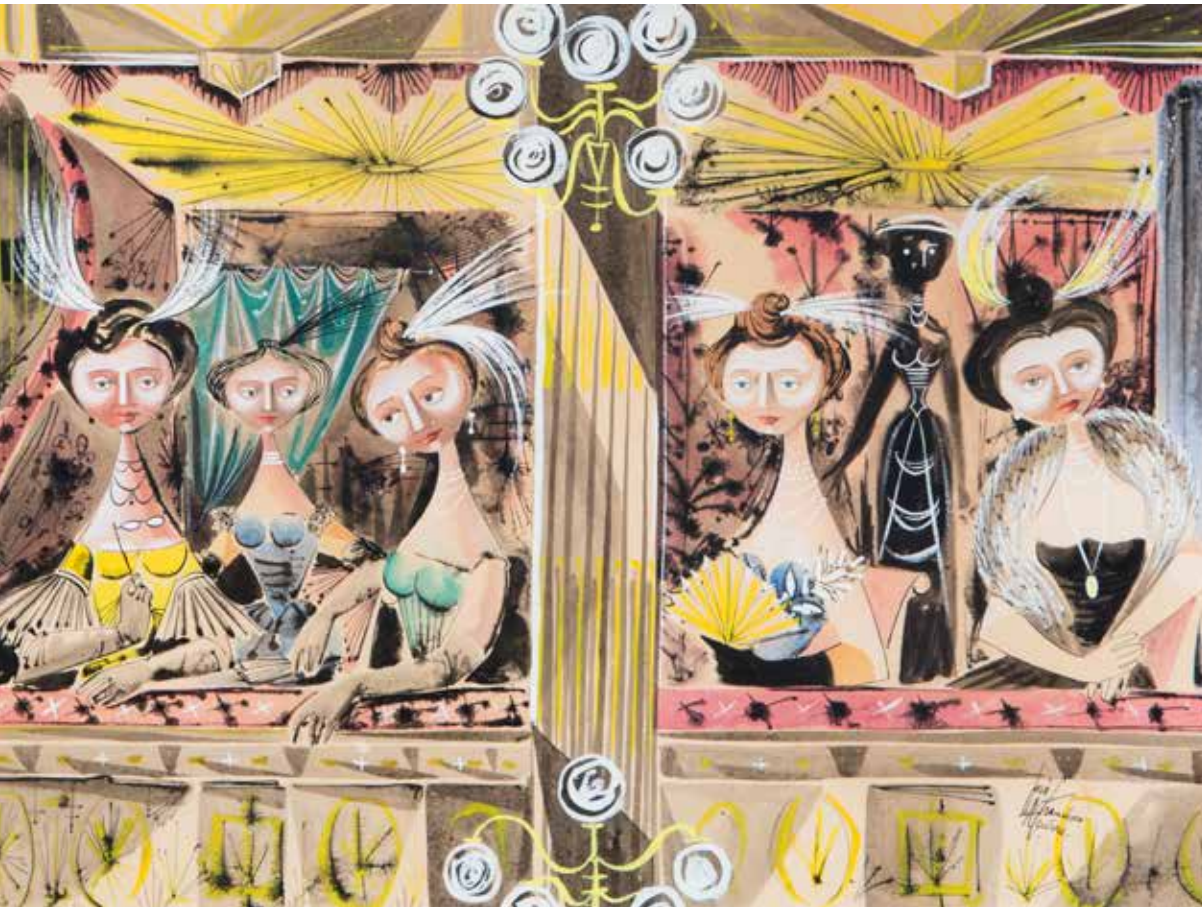
Noche de gala en el Romea / 1968 / Gouache / 32 x 43 cm

ruidosa, alegre y alborozada que le acompaña, rodeando el caballete, de risas y juegos. Sus hijos también son la selva de sus hermosos cuidados de dibujante. Pintor con influencias clásicas, plástico y adornado de elegancia. Decorativo en la justa medida de sus propósitos, como el mismo confiesa en una de sus entrevistas en tiempos de exposición abierta al público.