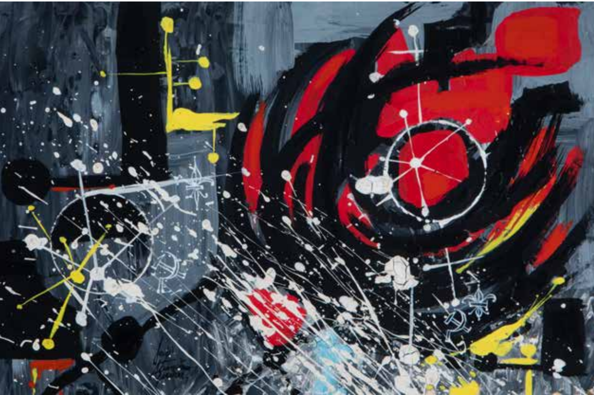
Ilustración abstracta para A.de Foxá / 1962 / Óleo sobre cartón / 25,5 x 39,5 cm

pág. 19 / 20. (Det.) Die Mondblume. Karibische Sagen / 1961 Autor: Rafael Morales Ilustraciones: José Francisco Aguirre Editorial Unión Verlag Stuttgart 27 x 21,5 cm