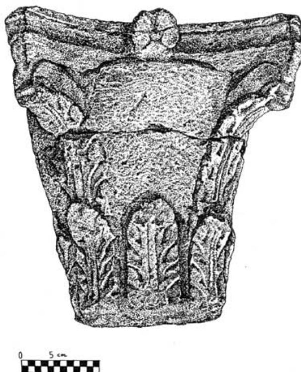
Fig. 40. Capitel corintizante procedente de la villa de los Villares (Zarzilla de Ramos)

La hoja de acanto con este tipo de perfil aparece con frecuencia en capiteles corintizantes que RONCZEWSKI (1923, p. 132) recoge en su clasificación con la letra A, ejemplos encontrarnos en un capitel de la Iglesia de Sta. María la Mayor, y en otro del Museo de Nápoles (RONCZEWSKI, K. 1923, p. 134, láms. 14 c y 14 D) . El capitel nº 36 de los Villares se acerca a los corintizantes de tipo A de RONCZEWSKI, pero con la diferencia de que los corintizantes de tipo A, llevan en la zona libre del kalathos una decoración de hojas lanceoladas.