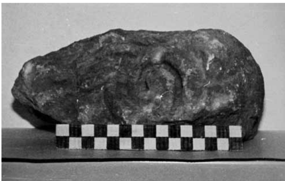
Lám 66. Villa de los Torrejones. Fragmento de voluta de capitel jónico nº 75

La tosquedad y erosión que presenta el fragmento hace difícil su encuadre cronológico. El contexto donde apareció y su semejanza con el capitel nº 8 del estudio de M. RECASENS (1979, p. 53) procedente del Museo Arqueológico de Tarragona, hacen que lo fechemos hacia finales del s. III d.C. e inicios del s. IV d.C.