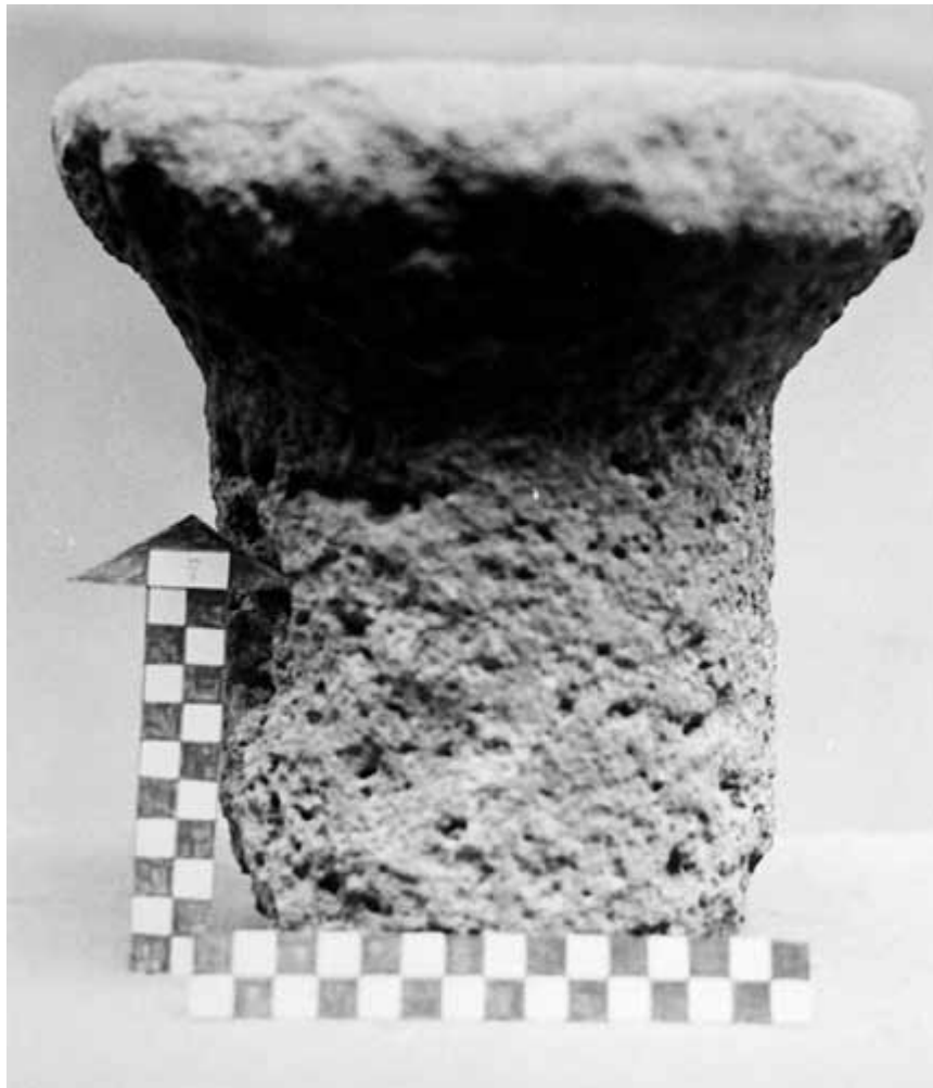
Lám. 64. Jumilla. Villa de la Alquería del Román. Capitel toscano nº 72