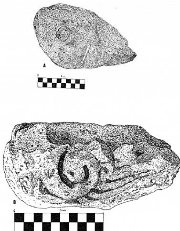
Fig. 69. A- Fragmento de voluta muy erosionada procedente de la tercera campaña de excavaciones (1985) en la villa de los Torrejones (Yecla) B- Fragmento de voluta de un capitel jónico procedente de la villa de los Torrejones (Yecla)