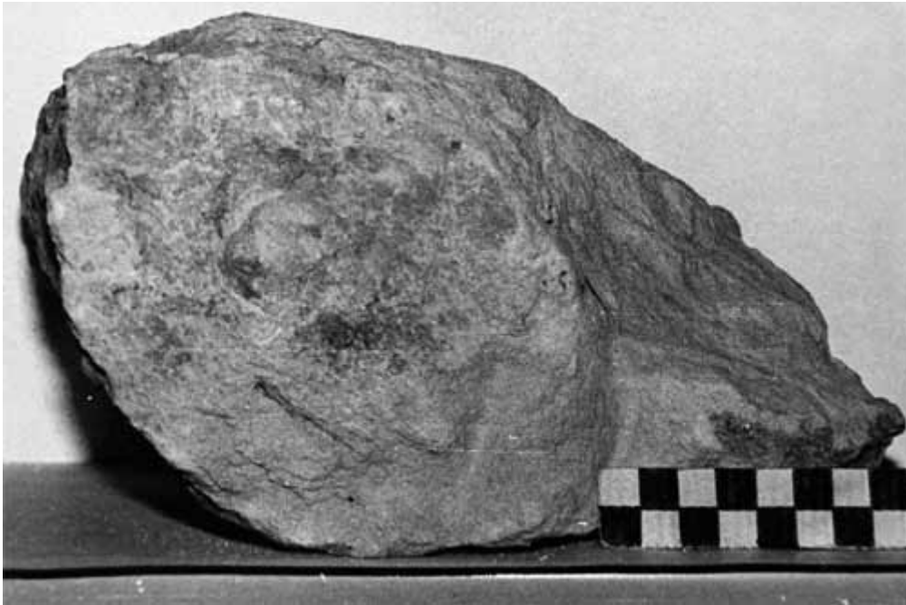
Lám 67. Yecla. Villa de los Torrejones. Fragmento de voluta de capitel jónico nº 76

Fecha a finales del s. III e inicios del S. IV d.C.