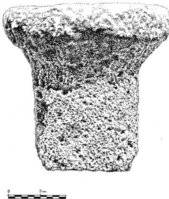
Fig. 67. Capitel toscano procedente de la villa romana de la Alquería del Román (Jumilla)