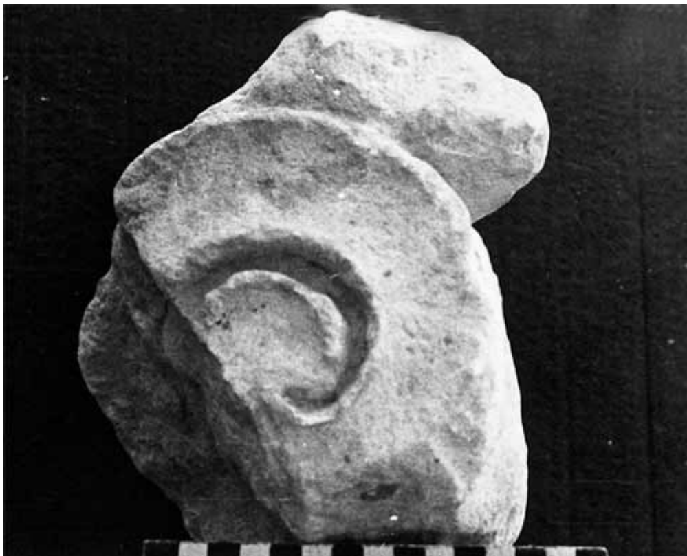
Lám 65. Cerro de los Santos. Voluta con decoración figurada nº 74

En los fondos del Museo Arqueológico de Murcia hay un capitel procedente de esta villa junto a fragmentos de cerámica ibérica pintada, T.S.A., T.S.H. y T.S.C.A., C y D, procedentes de una prospección fechada el 17 de Abril de 1966.