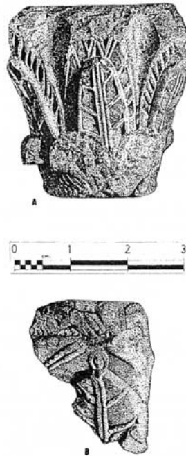
Fig. 64. A-Capitel pseudocorintio de la basílica del Llano del Olivar. B- Fragmento de hoja acantizante del mismo lugar

El capitel nº 63 se puede fechar en la segunda mitad del s. VI d.C.