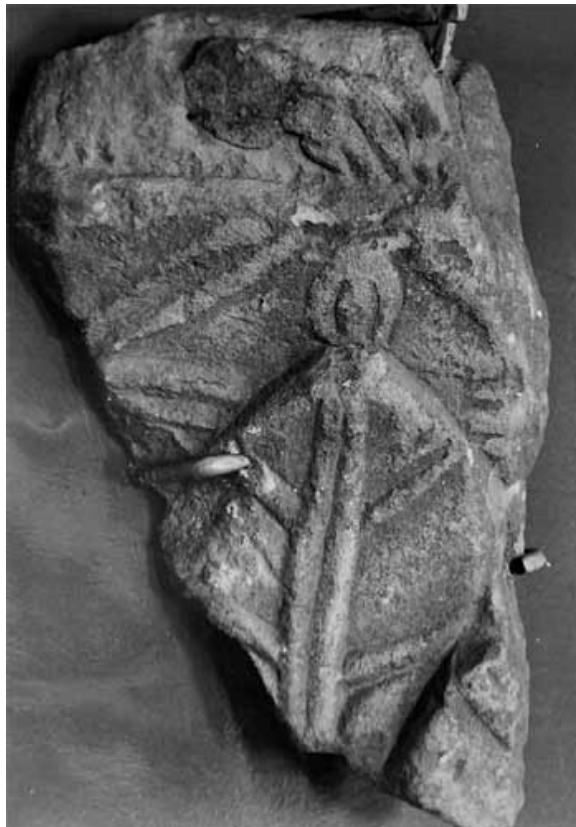
Lám 58. Basílica del Llano del Olivar. Fragmento de hoja acantizante nº 64 (neg. I.A.A)

Fragmento de hoja acantizante. La hoja dispone de una nervadura central formada por dos bandas paralelas de donde nacen las nervaduras para formar los lóbulos que se flexionan intentando crear sensación de naturalismo. El ápice de la hoja presenta un motivo oval. El pequeño espacio que se conserva de ábaco está muy erosionado.