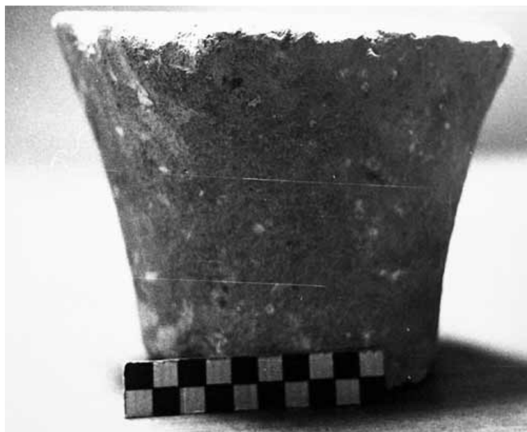
Lám. 61. Basílica del Llano del Olivar. Capitel sin labrar. Nº 67