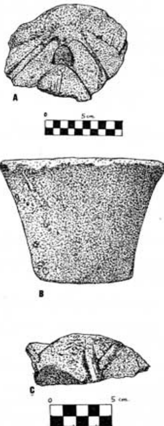
Fig. 64. A- Fragmento de hoja acantizante de la basílica del Llano del Olivar. B- Capitel sin labrar de la basílica del Llano del Olivar. C- Fragmento de hoja acantizante de la basílica del Llano del Olivar

Conservación: fondos del Museo Arqueológico de Murcia. Estado de conservación fragmento de pequeñas dimensiones. Material: caliza detrítica. Dimensiones: altura máx. conservada 7 cm. y anchura máx. conservada 9 cm. Bibliografía: Inédito.