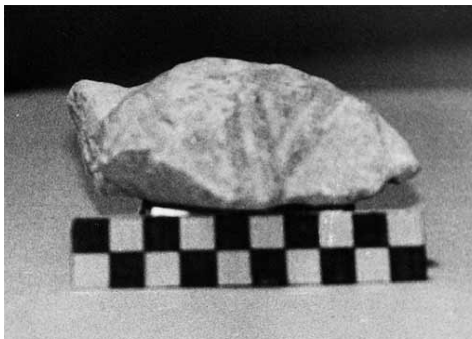
Lám 60. Basílica del Llano del Olivar. Fragmento de hoja acantizante nº 66.