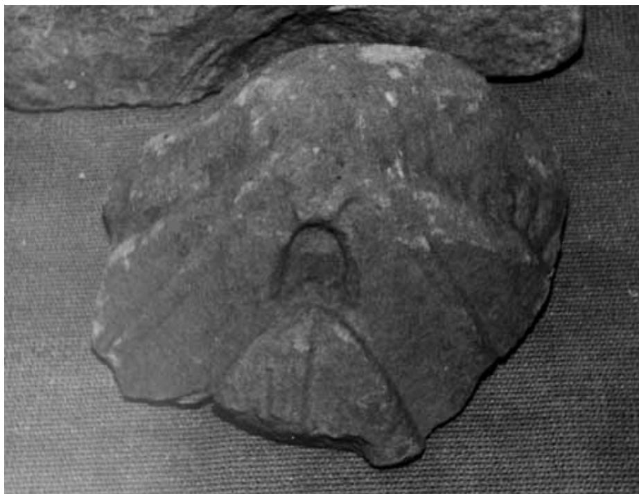
Lám 59. Basílica del Llano del Olivar. Fragmento de hoja acantizante nº 65

Fragmento de hoja acantizante. Solamente se puede apreciar la terminación de la nervadura central, y sobre el ápice el motivo oval. En este fragmento se distinguen mejor que en el fragmento nº 63 las posibles hélices, y sobre todo el ábaco posiblemente decorado.