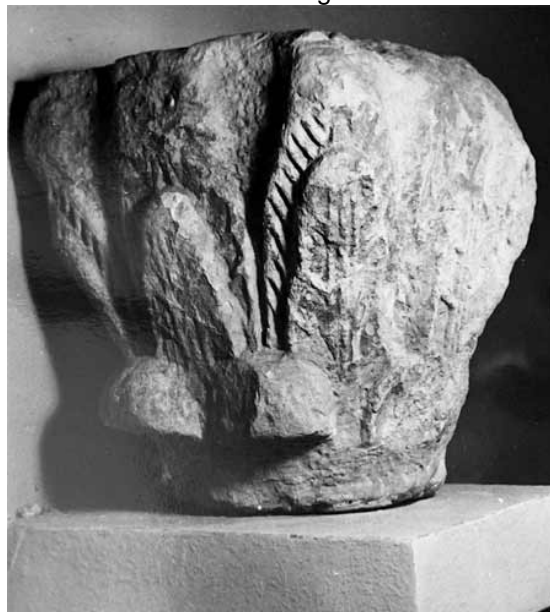
Lám 57. Basílica del Llano del Olivar. Capitel pseudocorintio nº 53