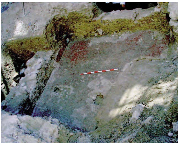
Lámina 3. Cata SO. Pueden apreciarse tanto el suelo como los dos muros de la habitación.