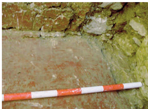
Lámina 4. Detalle del suelo y enlucido de la pared.