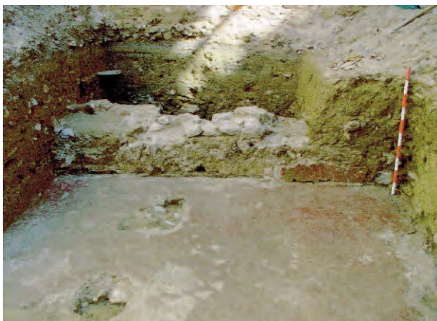
Lámina 5. Pared sur, en cata SO.

partir del punto de unión de los dos muros, para obtener cerámica en contexto sellado que nos permita obtener una cronología adecuada para las estructuras de las catas. Respecto a la estratigrafía, en el metro que se descendió en dicha cata no se hallaron estructuras, sino tan solo rellenos de tierra.