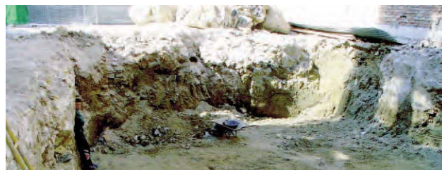
Lámina 2. Perfil norte, una vez finalizado el desfonde.