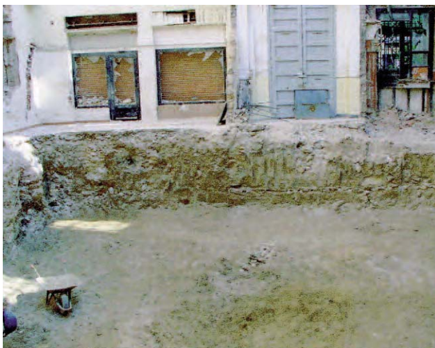
Lámina 1. Perfil sur, una vez finalizado el desfonde.