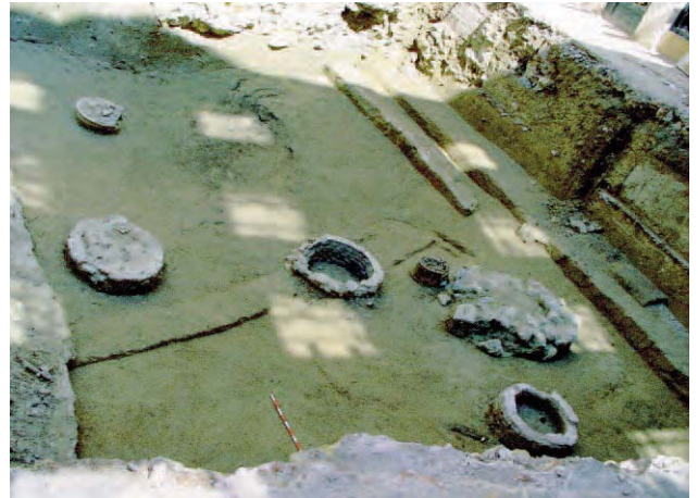
Lámina 6. Muros de adobe, uno de ellos interrumpido por un pozo moderno, en uso recientemente.

Finalizada la excavación del Centro y Sur del solar, se procedió al desfonde del tercio norte del solar. Se esperaba que dicho tercio hubiera permanecido menos tocado en profundidad que el resto del solar, ya que en realidad albergaba, al menos en parte, un edificio diferente, de menor altura y que no compartía el mismo historial de cimentaciones. Si bien aquí no se encontraron correas como las presentes en el resto del solar, otros elementos modernos aparecieron hasta cotas igualmente profundas, ocasionando la destrucción de los restos arqueológicos. Principalmente se trataba de una gran canalización de desagüe que ocupaba un tercio de la zona norte, realizada en hormigón y sin lugar a dudas datable en la segunda mitad del s. XX. El resto de la zona norte estaba ocupado por diversos pozos de edad