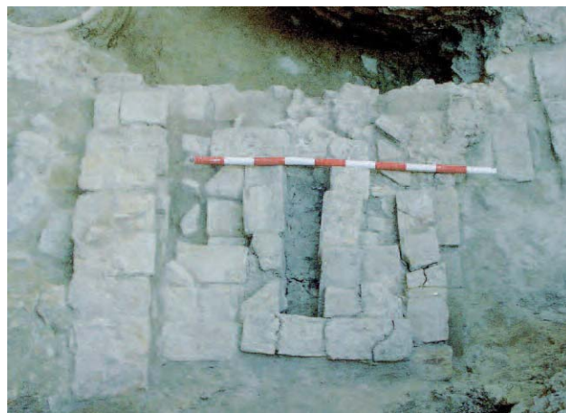
Lámina 11. Desagüe de casa hacia callejón de los Cubos.