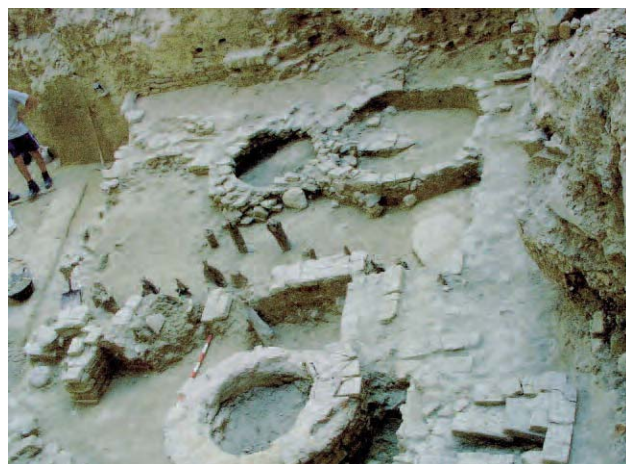
Lámina 12. Vista general del tercio Norte, siendo visibles los diversos pozos y cimentación de madera.