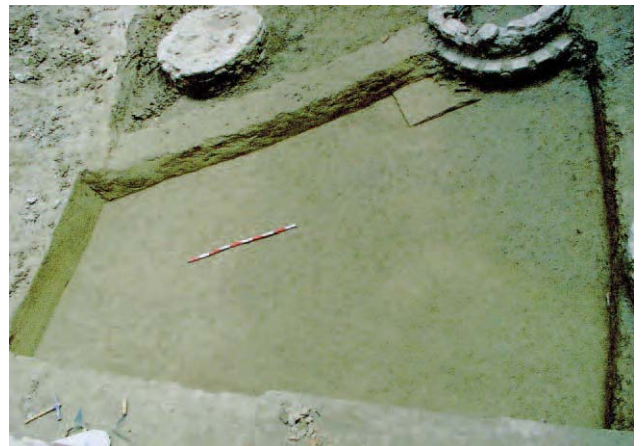
Lámina 7. Detalle del muro N-S en el que es visible un cierto "contrafuerte" en adobe.