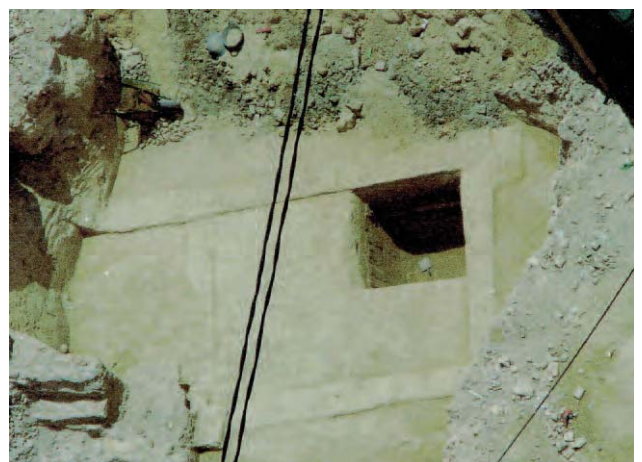
Lámina 8. La habitación hallada, estaría situada en la esquina NW del edificio, reforzada al exterior por contrafuertes del mismo material.