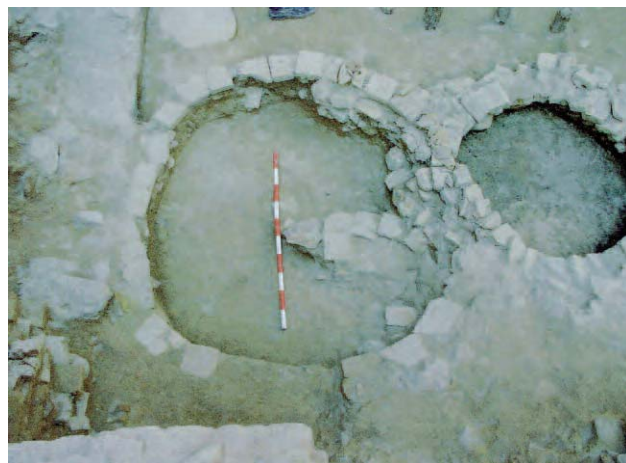
Lámina 10. Posible pozo de nieve, en la esquina de calle Oliver con callejón de los Cubos.