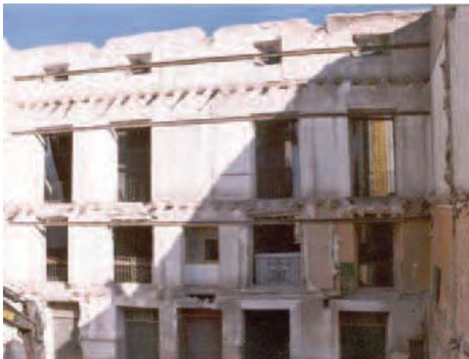
Lámina 1. Vanos de la fachada calle Selgas, vista interior.

diversos balcones de escasa entidad. La superficie de las paredes es lisa hallándose terminadas con un ajado enfoscado a base de diversas capas de yeso, constituyendo en general un aspecto de escaso interés urbanístico por la ausencia de elementos destacados.