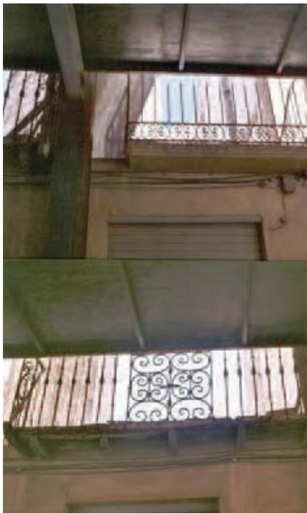
Lámina 2. Planta superior, vista interior.

reestructuración del inmueble para la finca 17, conservando la fachada principal abierta a la calle Selgas y elementos de interés citados.