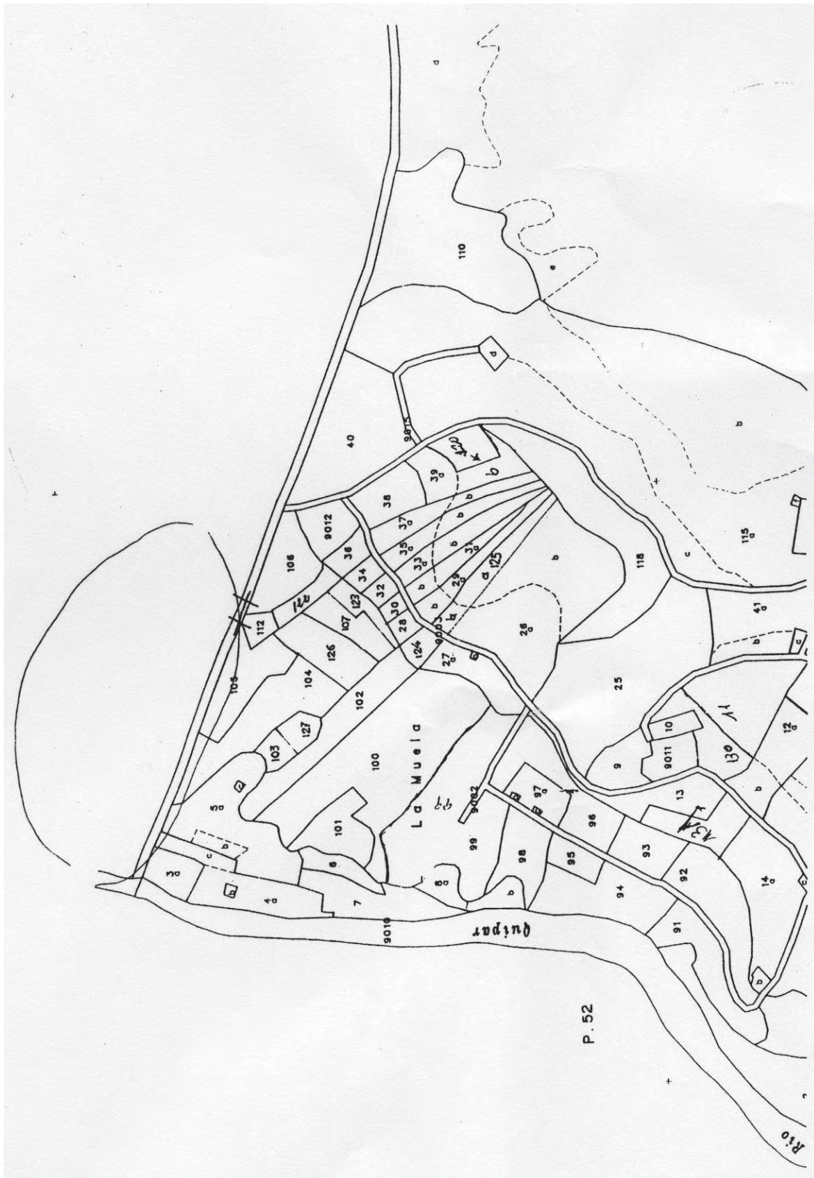
Figura 3. Plano catastral de la zona de los túneles con indicación de las fincas en las que los localizamos.