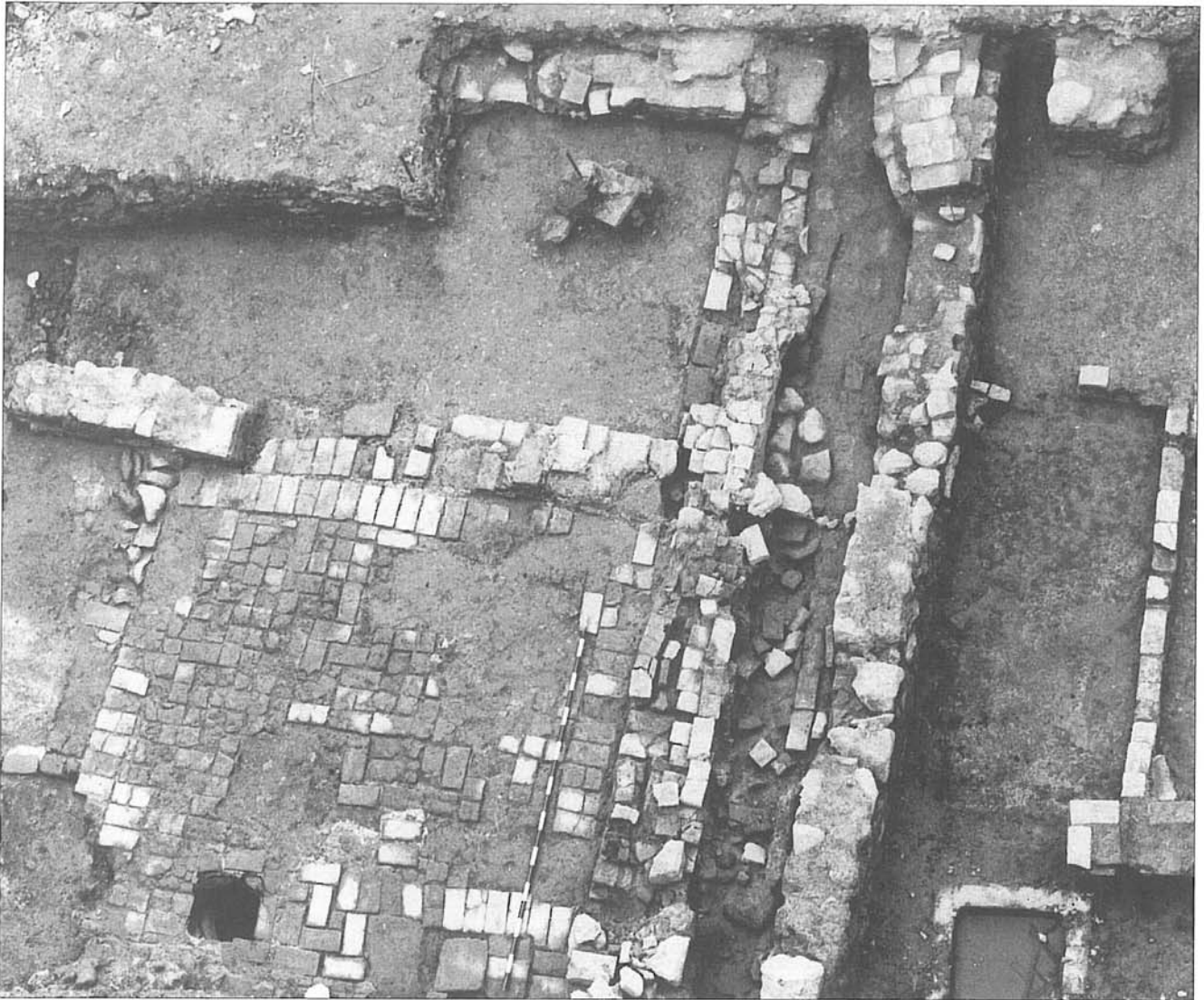
El edificio 2 en su momento final (Siglo XIII).