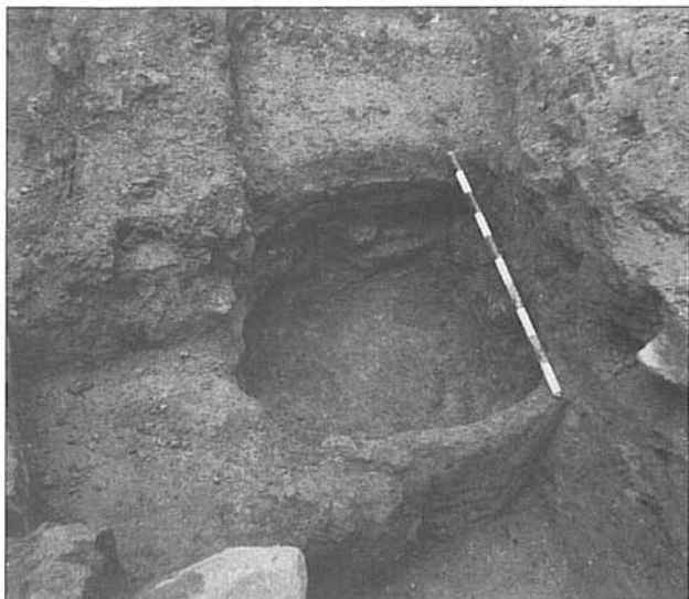
Horno cerámico (posiblemente para vidrio). Siglo XIII.

de forma aproximadamente cuadrangular que posiblemente estuvo a cielo abierto. Presentaba solería de mortero de cal y se hallaba cerrado por muros de ladrillo en los que se abrían dos vanos en otras tantas dependencias, destruidas por cimentaciones modernas. El muro que separaba el edificio del callejón estaba casi completamente destruido debido a la ampliación que en un momento posterior se hizo a costa del callejón. Esta reforma tiene lugar en un momento que podríamos situar "grosso modo" en la primera mitad del siglo XIII (Fig. 3); ello da lugar a la desaparición del callejón como tal, el espacio central del edificio 2 se repavimenta y el pozo es abandonado.