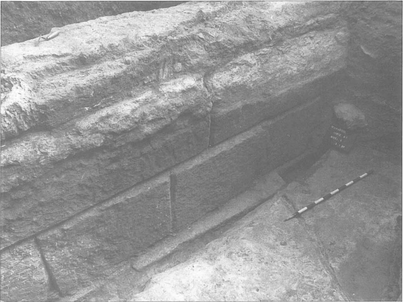
Detalle de la fosa de fundación y de los sillares empleados en la construcción.

todo, tratándose de un material de alta porosidad y fácilmente deleznable por la acción de los agentes atmosféricos; por otra parte, este tratamiento sobre la superficie de los elementos constructivos, al mismo tiempo, podría responder a motivos puramente estéticos, ocultando el aspecto real de una materia de calidad mediocre, proporcionándole un aspecto más noble.