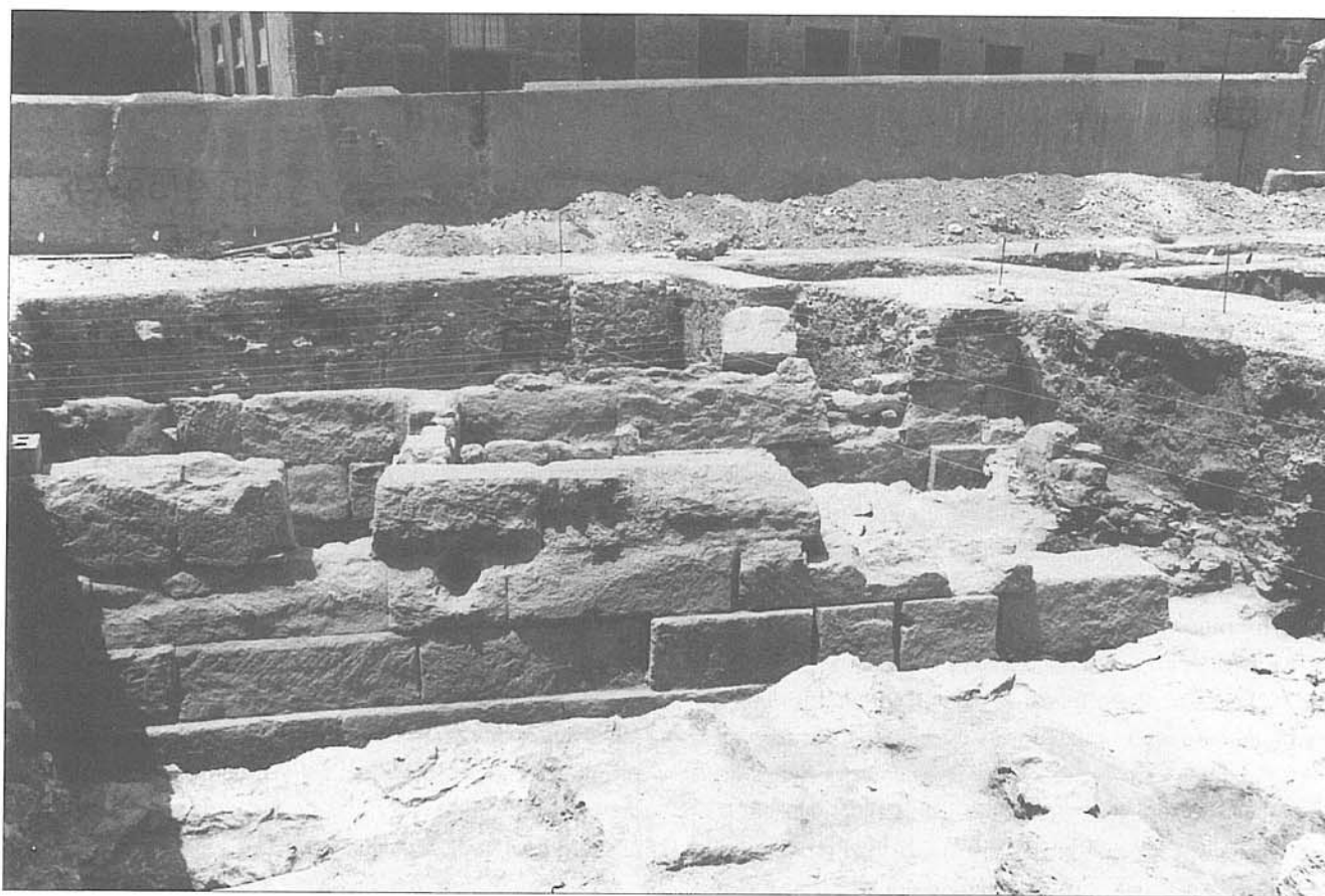
Panorámica general de la muralla, vista desde la parte exterior o frente.

erosionable, estas estructuras podrían verse afectadas seriamente desde el punto de vista erosivo, por la acción de los distintos agentes atmosféricos, especialmente por las lluvias. En este sentido, se ha logrado la protección de la totalidad del área excavada con una cubierta o tejadillo de chapa metálica sustentada sobre cerchas y pilares metálicos.