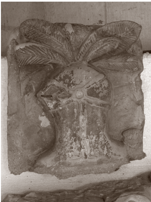
ANTERIOR A LA INTERVENCIÓN. DETALLE YELMO

Centro de Restauración de la Región de Murcia.