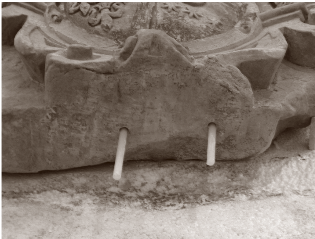
DURANTE LA INTERVENCIÓN. COLOCACIÓN DE ESPIGAS