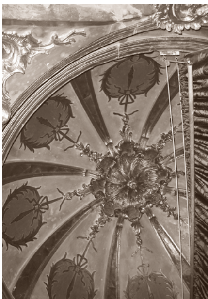
ANTERIOR A LA INTERVENCIÓN