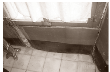
ANTERIOR A LA INTERVENCIÓN