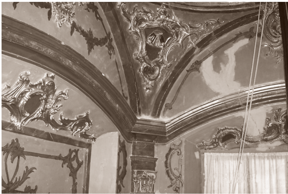
ANTERIOR A LA INTERVENCIÓN