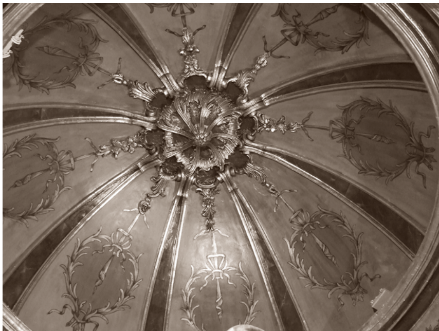
ESTADO FINAL DE LA CÚPULA, CON LAS YESERÍAS, DORADOS Y POLICROMÍAS