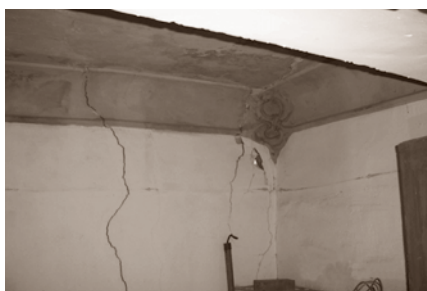
ANTERIOR A LA INTERVENCIÓN