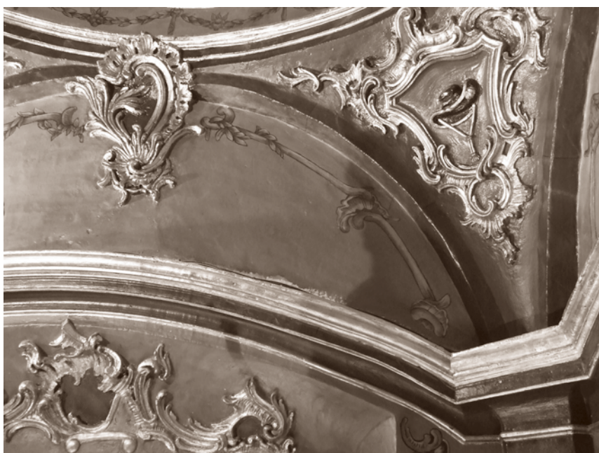
PECHINA Y MOLDURAS DESPUÉS DE LA INTERVENCIÓN