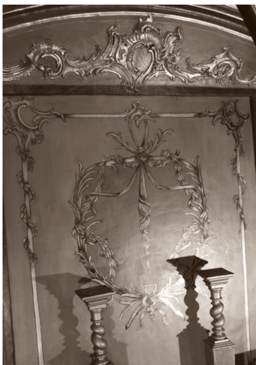
VISTA DEL FONDO DE LA CAPILLA DESPUÉS DE LA INTERVENCIÓN