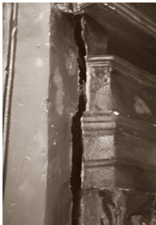
DETALLES DEL AVANZADO ESTADO DE DETERIORO

De su ornamentación, se puede reseñar sus decoraciones barrocas originales del siglo XVIII; la finura de las rocallas y molduras, así como la fusión de elementos ornamentales de volumen con las policromías y las decoraciones pictóricas parietales, conectadas con finas líneas que se confunden, dándole al conjunto una apariencia espacial más profunda.