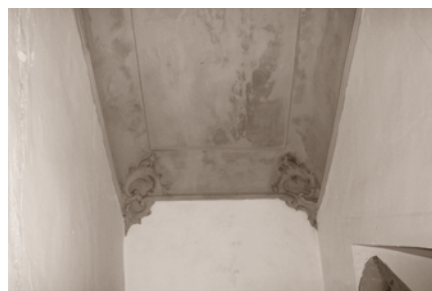
ANTERIOR A LA INTERVENCIÓN