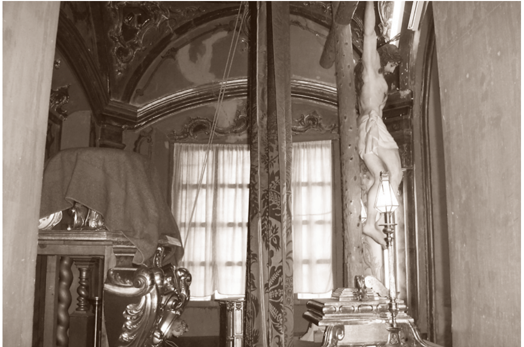
ANTERIOR A LA INTERVENCIÓN