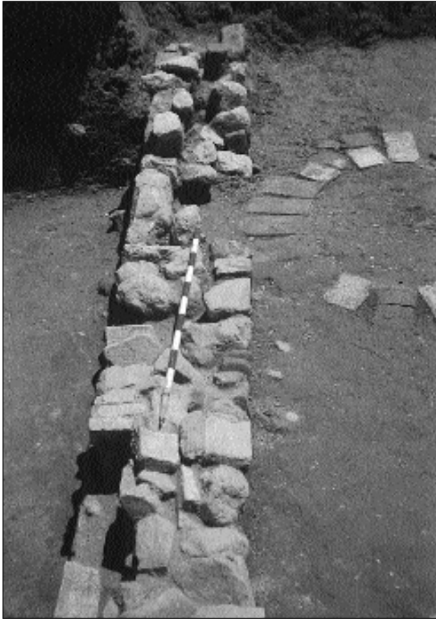
3.-Muro que delimita la calle al Sur. Bajo el jalón se puede ver el umbral.