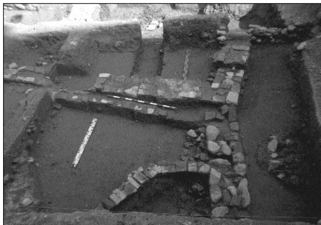
5.-Detalle de los espacios 2 y 3.

después de la del pilar, se construyó un vano al Este del mismo que no tiene paralelos al Oeste.