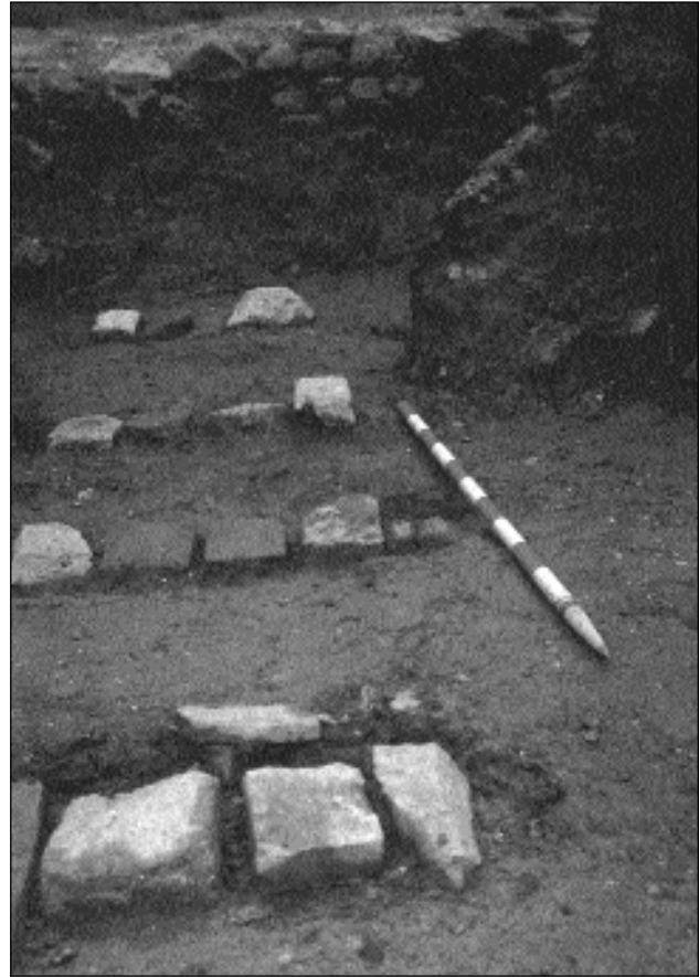
4.-Detalle de las hiladas de ladrillo que delimitan la calle al Sur.

Otro aspecto a destacar es que los dos muros que delimitan este ambiente son de naturaleza totalmente distinta. Al