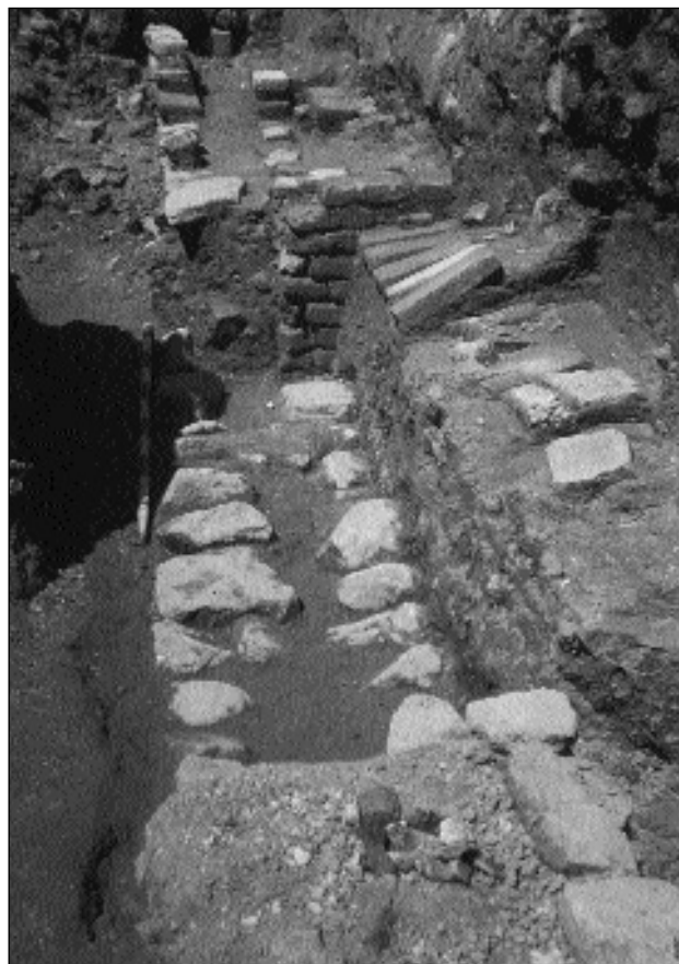
2.-Muro Norte del corte 1. Se observa el pilar que estaba embutido en él y el umbral más moderno.

Se abre al Sur del corte 1. La estratigrafía arroja materiales modernos entre los siglos XV y XVII, destacando entre todas, las cerámicas de paterna. No hay estructuras excepto un pozo, posiblemente de agua y la continuación del muro de piedra del corte 1, que en un tramo queda roto por el pozo anterior.