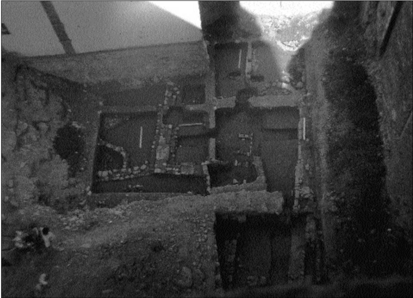
1.-Vista aérea de la excavación desde el Oeste.

No se sigue excavando en profundidad por aparecer niveles freáticos. En cuanto al corte 2 se comienza a excavar, saliendo a la luz restos de los cimientos del último edificio que ocupó el solar. Tras hacer unas catas y comprobarse que la estratigrafía es semejante a la del corte 1 (en el que aparecen los restos a más de 2 m. bajo la cota 0), se decide bajar el resto del terreno con máquina hasta una profundidad de 2 m. y excavar en extensión. Una vez rebajado se plantean tres nuevos cortes: el 3 de 4 x 3.5 m. al Oeste del corte 2, el 4 de 4 x 4 m. entre el corte 2 y la calle y el 5 de 4.5 x 4.5 m. entre el corte 1 y la acera.