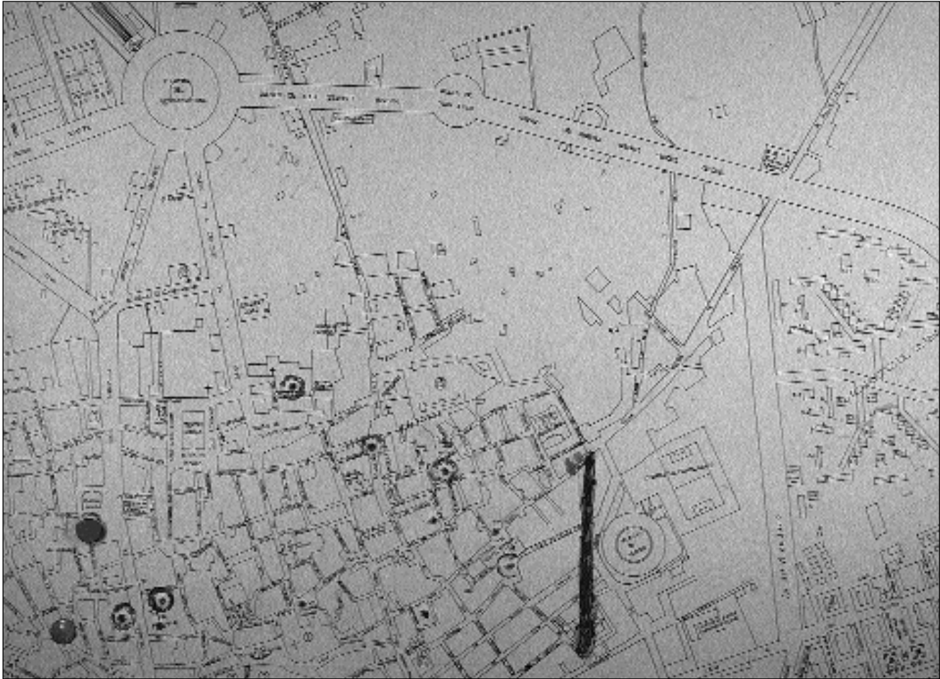
6.-Posible tramo de muralla entre la Puerta de Orihuela y la de Santa Eulalia y situación del solar.

7.- Es muy interesante constatar que la calle islámica tiene una inclinación ascendente igual que la de Mariano Vergara. Quizá la inclinación se deba a que en la zona de la Puerta de Orihuela el río, o el meandro del río que por allí pasaba haya ido aportando materiales o incluso a que la proximidad de éste hubiera hecho que de forma artificial se sobreleva el terreno como medida de protección frente a eventuales crecidas.