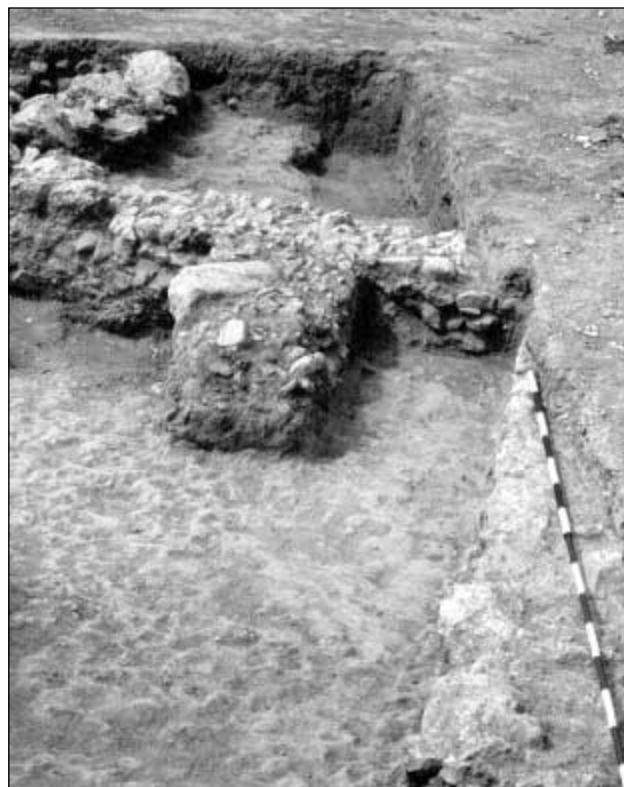
Detalle de estructuras.

drar una habitación, que denominamos Ambiente 2.