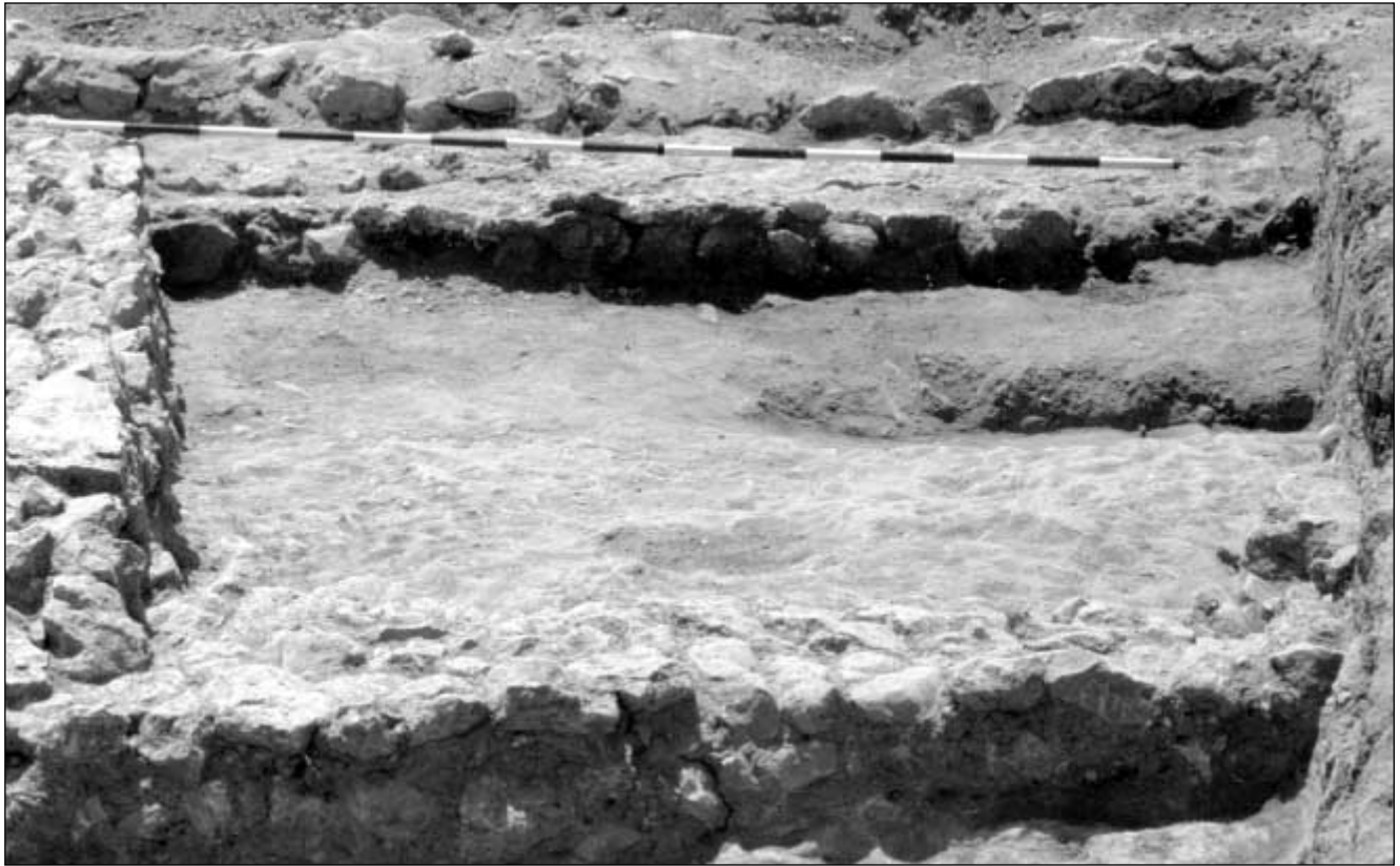
Detalle de estructuras.

un fuerte buzamiento de N a S, que hace que las construcciones romanas se adapten a su inclinación. en cuanto a las características son las mismas que las del estrato V, y corresponde a otro periodo de lluvias torrenciales, con gran arrastre de gravas y cantos rodados de diversos tamaños.