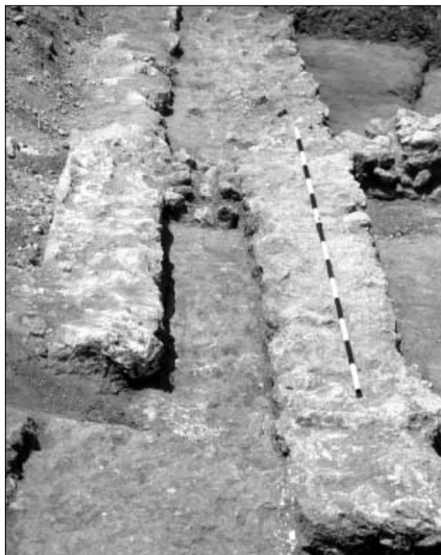
Detalle de estructuras.